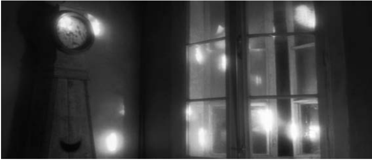
4 Lichtflecken im Studio der Quays

se in pulsierendem Gleißern niederschlug. Lichtmuster und Strahlen waren mit dem Lauf der Sonne quer über die Sets gewandert. Dieser «Fehler», eine veritable «Epiphanie» (Quay Brothers 1996), wurde zur preisgekrönten «Entdeckung des Lichts» von IN ABSENTIA . Die Quays verstärkten und lenkten die Sonnenstrahlen durch Spiegel und Reflektoren, um sie den Erfordernissen der Szenen anzupassen (vgl. Aita 2001, o.S.). Andere frühe Missgeschicke führten zu ähnlich originellen Lösungen: Bei den Dreharbeiten zu STREET OF CROCODILES hinterließ ein Spotlight unerwünschte Effekte auf den Porzellanköpfen im Schneideratelier. Schließlich gelang es, diese Effekte mithilfe von Watte in sanft-glimmende Strahlenkränze zu verwandeln und Licht durch die leeren Augenhöhlen schimmern zu lassen (Abb. 3a–d). Die Wirkung ist schön und unheimlich zugleich, da sie die physische und geistige Leere der Puppen unterstreicht.