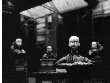
3a-d STREET OF CROCODILES (The Quay Brothers, GB 1986)

Die Puppen und Objekte werden zu Automaten, die lautlos die Routinen des Alltags vollziehen, materielle Stellvertreter, die von den Händen ihrer Schöpfer manipuliert und animiert werden. Auch bei einigen der Lieblingsautoren der Quays figurieren Automaten bereits prominent – in E.T.A. Hoffmanns Erzählung Der Sandmann , in Schulz' kurzen Texten oder bei Robert Walser. In dem Quay-Film THE PIANO TUNER OF EARTHQUAKES dient ein Automat als zentrales Konstituens, sowohl für die animierten Sequenzen wie für die Hauptfigur Malvina (verkörpert durch Amira Casar).