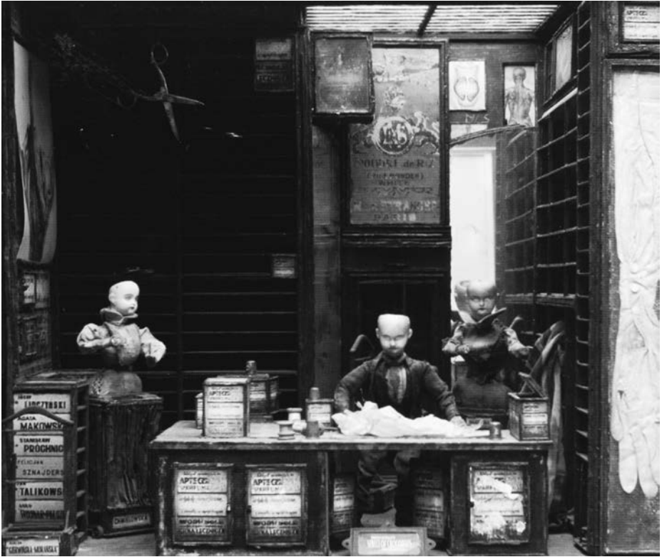
Set für STREET OF CROCODILES (The Quay Brothers, GB 1986)