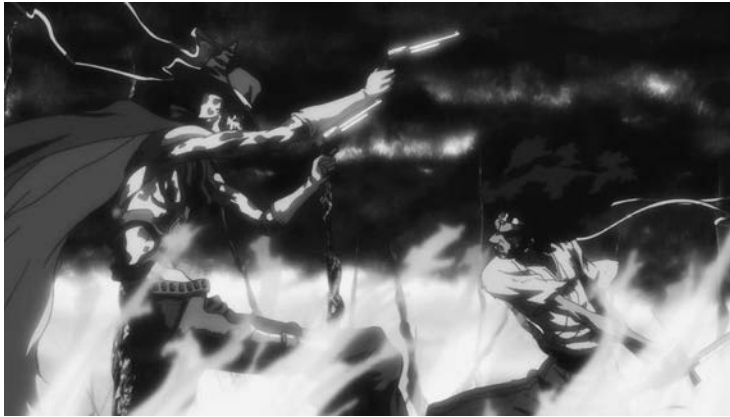
3 Western- Elemente im Showdown der TV-Serie

sie streift. In der Diegese von AFRO SAMURAI trifft Hochtechnologie wie Cyborg-Wesen, Mobiltelefone und Raketenwerfer auf ein japanisches Mittelalter, das durch seine Repräsentation in chanbara bekannt ist. Hinzu kommen ikonografische, aber auch motivische Elemente aus zahlreichen weiteren Genres: Der finale Gegner des Protagonisten ist wie eine Western-Figur gekleidet, mit Stetson-Hut und langem Staubmantel, unter dem er sechsschüssige Revolver trägt; 2 der Topos um den Hegemoniestreit unter den Schwertkämpfen stammt aus der Tradition von chinesischen Martial-Arts-Narrativen und wuxia -Mythen (vgl. Teo 2009); und Afro selbst wird stets begleitet von einem imaginären Alter Ego, das aber dennoch eine irritierende materielle Präsenz besitzt, immer wieder mit der Umwelt interagiert und daher dem Fantasy-Genre zuzurechnen wäre.