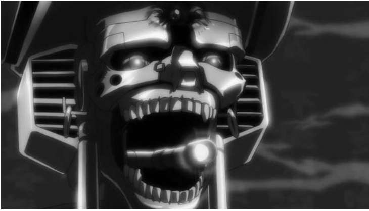
4 Anspielungen auf das Science-Fiction-Genre in AFRO SAMURAI (TV-Serie)

ferenten, ja überhaupt auf Bezüge zur japanischen Geschichte. Es operiert lediglich mit bekannten generischen Versatzstücken und spielt so mit dem medienkulturellen Wissenshorizont des Publikums.