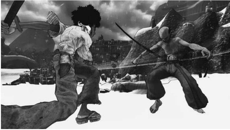
2 Videospiele zu AFRO SAMURAI (Japan 2009)

positiv und damit als Teil eines «transmedia storytelling» (Jenkins 2006) gelten könnte. Transmediales Erzählen ist dadurch charakterisiert, dass Teile einer Geschichte auf unterschiedliche Medienplattformen verteilt werden, wobei jedes Medium im Idealfall seine spezifische Stärke ausspielen kann: «Stories unfold across multiple media platforms, with each new text making a distinctive and valuable contribution to the whole» (ibid., 95f). In diesem Sinne ergänzt das Konsolenspiel AFRO SAMURAI sein Franchise einerseits um narrative Details, insbesondere durch Flashbacks in die Adoleszenz des Protagonisten; andererseits testet es durch die interaktive Anlage auch die Geschicklichkeit der Spielerin und synchronisiert diese auf besonders intensive Weise mit dem Avatar. Afros Exzellenz im Schwertkampf wird zur Frage des Beherrschens der Spielmechanik.