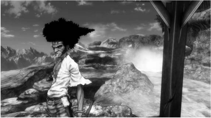
1 TV-Serie AFRO SAMURAI (Japan 2007)

und das Ganze auch auf diese Weise rezipiert werden will. Anders als in der Episodenserie ( series ) mit in sich abgeschlossenen Folgegeschichten wird hier nicht eine ähnliche Geschichte immer wieder erzählt, sondern eine Geschichte auf ähnliche Weise immer weiter erzählt. Dies geschieht allerdings nicht notwendig linear: AFRO SAMURAI ist von einer verschachtelten Erzählstruktur geprägt, die insbesondere in zahlreichen Rückblenden und intern fokalisierten Traumsequenzen sowohl Kindheit als auch Ausbildung des Protagonisten schildert. Ferner schließt die Serie in der fünften und finalen Episode nicht mit einer konventionellen Konfliktlösung, sondern endet abrupt, wenn Afro zwar den Tod des Vaters gerächt hat, nun aber seinerseits von einem alten Widersacher aus Jugendtagen zum Kampf herausgefordert wird.