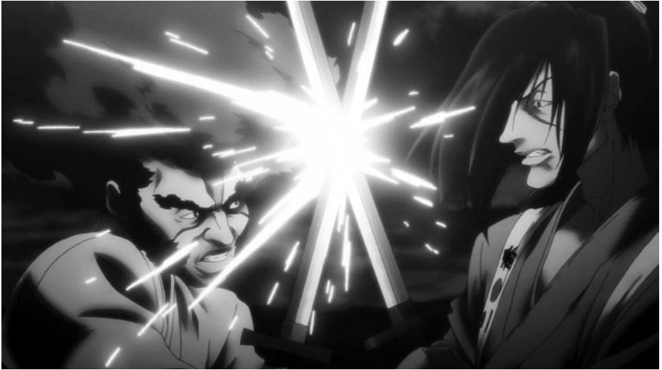
Typischer anime-Look: AFRO SAMURAI: RESURRECTION (Japan 2009)