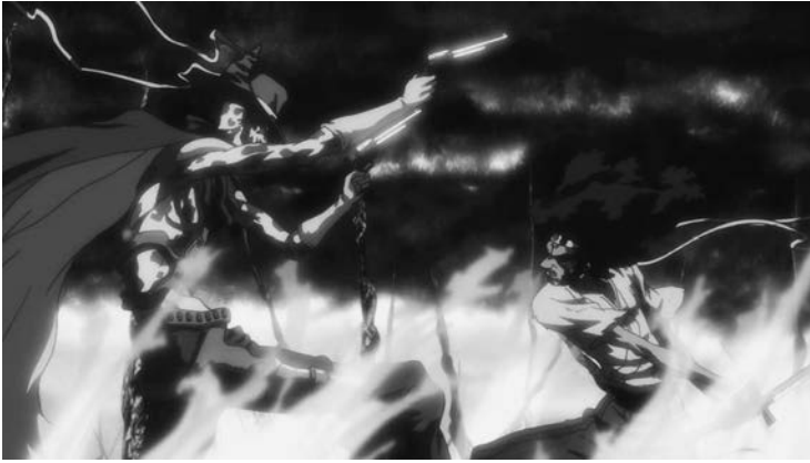
3 Western- Elemente im Showdown der TV-Serie

sie streift. In der Diegese von AFRO SAMURAI trifft Hochtechnologie wie Cyborg-Wesen, Mobiltelefone und Raketenwerfer auf ein japanisches Mittelalter, das durch seine Repräsentation in chanbara bekannt ist. Hinzu kommen ikonografische, aber auch motivische Elemente aus zahlreichen weiteren Genres: Der finale Gegner des Protagonisten ist wie eine Western-Figur gekleidet, mit Stetson-Hut und langem Staubmantel, unter dem er sechsschüssige Revolver trägt; 2 der Topos um den Hegemoniestreit unter den Schwertkämpfen stammt aus der Tradition von chinesischen Martial-Arts-Narrativen und wuxia -Mythen (vgl. Teo 2009); und Afro selbst wird stets begleitet von einem imaginären Alter Ego, das aber dennoch eine irritierende materielle Präsenz besitzt, immer wieder mit der Umwelt interagiert und daher dem Fantasy-Genre zuzurechnen wäre.