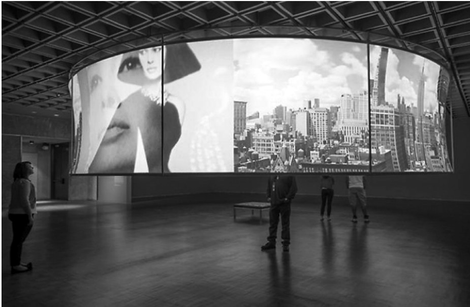
2 IN THE AIR, 2013, von T. J. Wilcox. Panorama-Filminstallation: Super-8-Film auf Video übertragen, HD-Video, Schwarzweiß und Farbe, stumm, 35 min. im Loop.

nien der Abendröte erzählen und die jeweils eine narrative Schließung gegenüber der offenen Panoramansicht suggerieren. Während diese Geschichten wie kurzweilige Schaufenster wirken, sind in einem Seitenkorridor tatsächliche Schaukästen befestigt, die mit Postern die jeweiligen Clips bewerben. Hinzu kommen noch die auf zwei Nebenräume verteilten Skulpturen, Gemälde und Filme, die der Künstler aus dem Whitney Archiv auswählte.