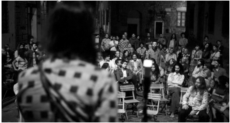
Stills aus APRÈS MAI (Olivier Assayas, F 2012)