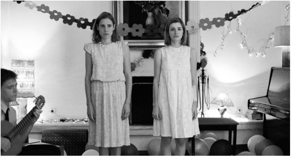
KYNODONTAS (DOGTOOTH, Giorgos Lanthi- mos, GR 2009)