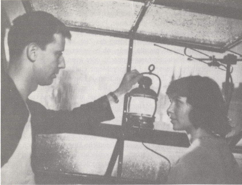
Renate Blume als Rita Seidel in Konrad Wolfs Der geteilte Himmel , nach dem Roman von Christa Wolf

Die "Ankunft im Alltag" wird auch durch das Äußere betont: Unscheinbar und auf den ersten Blick irritierend unvorteilhaft gekleidet und zurechtgemacht treten die Frauen und Mädchen in den Filmen uns entgegen - oder ist es nur unser auf Glamour abgerichteter Kinoblick, der sie uns als so unheldisch erscheinen läßt. Naivität gehört zum dramaturgischen Arrangement, in dem sie die Rolle des Mediums von Ansprüchen übernehmen, die wohl anders als durch die Unschuld legitimiert nicht würden "auftreten" dürften.