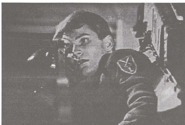
Subjektive Kamera in Besuch von drü- ben . (aus Video- Mit- schnitten in SAT I, 1994)