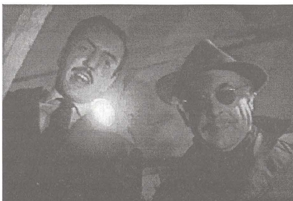
Im Gegenlicht: Agenten vor neuem Komplott