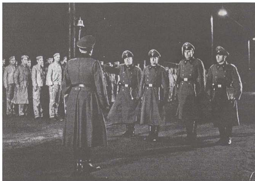
Ein Tag, 1965

Nicht nur der Umstand, daß die schreibende Hand ohne weiteres zur mordenden werden kann, kennzeichnet die besondere Situation der SS-Leute. Die