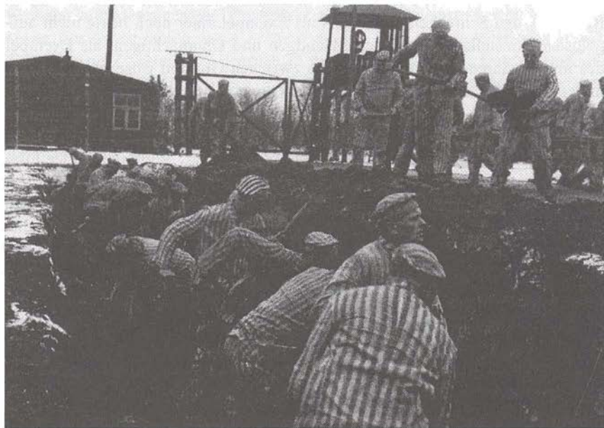
Ein Tag, 1965