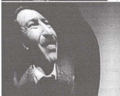
Das Gesicht des Taxifahrers spiegelt sich in der Weihnachtskugel