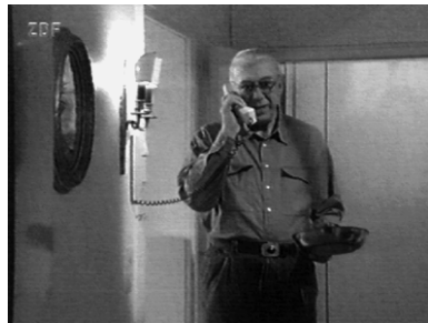
Wieder nichts mit Feierabend. (Teestunde mit einer Mörderin)