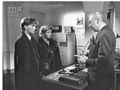
Standpunkte: Derrick gibt keine 1000 DM-Scheine, sondern Fingerzeige. ( Höllenstein )