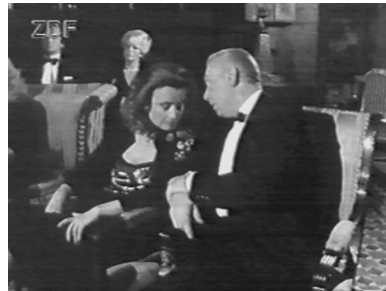
Bye-bye. Ein Abschied für immer. ( Ein Spiel mit dem Tod )

gerufen, will sie mit ihm essen, kommt er zu spät und wird doch gleich wieder ins Büro gerufen, noch bevor der Aperitif gekommen ist. Selbstverständlich geht er. Selbstverständlich geht auch sie bald, denn: „Ich will mein Leben nicht mit Mördern teilen. Und das müßte ich in einem Leben an deiner Seite.“ Auch sie taucht danach nur noch einmal auf, in der 117. Folge, Angriff aus dem Dunkel . Ab Abendessen mit Bruno (242) und bis Hölle im Kopf (272)