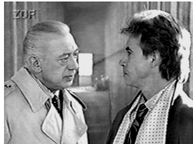
Wer zuerst blinzelt, verliert. ( Höllenstein )