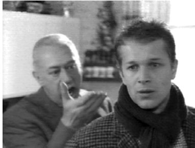
Derrick predigt einem jungen Menschen seine Ansichten. ( Blaue Rose )

Derrick: Sagen wir mal so: Sie haben etwas begriffen. Verstehen ist etwas ganz anderes.