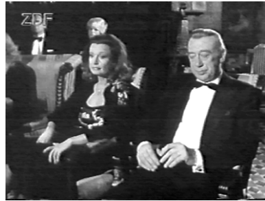
Ein Konzert ist manchmal nicht so spannend wie ein Mord...

„Daß die Beziehungen jetzt fehlen, das ist sicher mein Fehler, liegt auch in meinem Beruf begründet“. Ähnliches zeigt sich aber auch an den beiden Beziehungsversuchen in der Derrick -Serie. Ganz zu Anfang versucht er 1975 in Pfandhaus (11/1975) sein Glück mit der Psychologin Renate Konrad, gespielt von Johanna von Koczian. Doch Derrick ist immer abwesend, wenn er bei ihr ist, denkt an seinen Fall und an den Mörder – er bleibt der Oberinspektor. Einmal hat seine Freundin ihn soweit, daß er im Begriff ist, sich auszuziehen. Doch kaum ist das Hemd geöffnet, klingelt das Telefon. Es ist Harry – und Derrick ist sichtbar erleichtert, daß er gehen darf. Die Psychologin droht ihm daraufhin, sich mit einem Patienten einzulassen und ist tatsächlich bald darauf verschwunden; ihr zweiter Auftritt in Schock (20/1976) ist zugleich ihr letzter. Wenig besser ergeht es Ariane (Margot Medicus) in Ein Spiel mit dem Tod aus dem Jahre 1984. Ist sie mit Derrick im Konzert, wird er zu einem Mord gerufen, will sie mit ihm essen, kommt er zu spät und wird doch gleich wieder ins Büro gerufen, noch bevor der Aperitif gekommen ist. Selbstverständlich geht er. Selbstverständlich geht auch sie bald, denn: „Ich will mein Leben nicht mit Mördern teilen. Und das müßte ich in einem Leben an deiner Seite.“ Auch sie taucht danach nur noch einmal auf, in der 117. Folge, Angriff aus dem Dunkel . Ab Abendessen mit Bruno (242) und bis Hölle im Kopf (272)