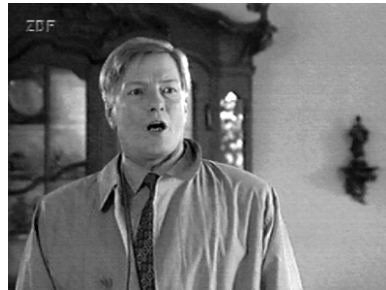
Die Witwe geht skrupellos über die Blutlache hinweg. Der Freund des Ermordeten ist bestürzt. ( Das Floß )