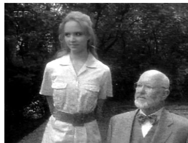
Unschuldig und weichgezeichnet: Ein Bild von einem Mädchen. ( Pornocchio )

Die erste Funktion dieses dritten Typs junger Menschen in Reineckers ‚moralischer Anstalt‘ erschließt sich dann auch über die Bedeutung der Sexualität: In seiner Autobiographie bekennt er, daß in