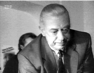
Immer diese Drogen... ( Blaue Rose )

Unmoral zu scheiden“ 10 . Hierfür setzt Reinecker drei verschiedene Grundtypen junger Menschen ein.