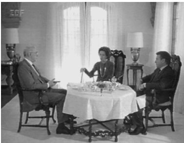
Die Mörderin lädt zum Tee. ( Teestunde mit einer Mörderin )

um die Realität des Verbrechens“ 55 , bekennt Reinecker seine Auffassung von Realismus. Und: „Ich decke nicht die Methoden der Polizei auf, sondern die Motive der Leute, die mit der Polizei zu tun haben.“ 56 Damit ist es auch müßig, darüber zu debattieren, ob die in Derrick gezeigte Ermittlungsarbeit realistisch bzw. zeitgemäß ist oder nicht. Denn Derrick ermittelt auf seine ganz eigene Art: In (langen) Gesprächen. Und diese haben oft einen sehr ruhigen, sehr privaten Charakter. Derrick geht mit den Verdächtigen zum Essen oder Kaffeetrinken, besucht sie, fährt mit ihnen Auto. So möchte er die Verdächtigen kennenlernen und ihre Motivation verstehen. Über die Nähe sucht er den Zugang zu ihrem Innersten, denn Derrick „ist eine psychologische Filmserie, [...] da muß man auch zuhören“ 57 , erläutert Tappert. Hat er dann seine Schlüsse gezogen, gibt es zwei Möglichkeiten, den Täter zu überführen: Erstens stellt er ihm manchmal mit einer Überrumpelungstaktik eine Art Falle, oft verbunden mit psychischem Druck. So konfrontiert er beispielsweise in Der stille Mord die drei Vergewaltiger nochmals mit dem Tatort, an dem plötzlich die drei (bewaffneten) weiblichen Racheengel auftauchen, die aufgrund einer erlebten