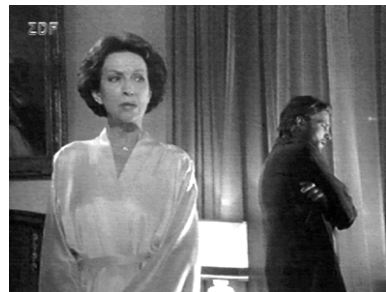
„Die Liebe wird ermordet.“ (Teestunde mit einer Mörderin)

setzung mit der Mordtat auf einer nachgerade philosophischen Ebene verdeutlicht nochmals, daß es nie die einfachen Menschen sind, die einen moralisch begründeten Mord begehen. Vielmehr sind es nachdenkliche, feingeistige Täter, die mit ihren hohen theoretischen Erwartungen an das Leben an den Verhältnissen gescheitert sind. Weil das „echte“ Leben oftmals nur ein billiges Schauspiel ist, angereichert mit sexueller Gier oder anderen niederen Bedürf-