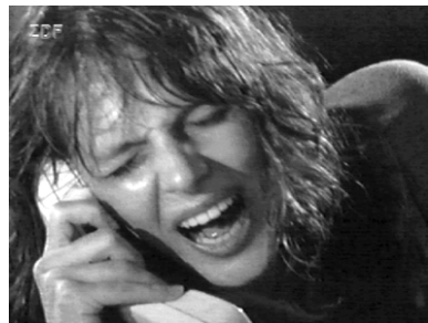
Mutter in New York, Tochter an der Nadel: Ein Telefonat ist da zu wenig. ( Judith )