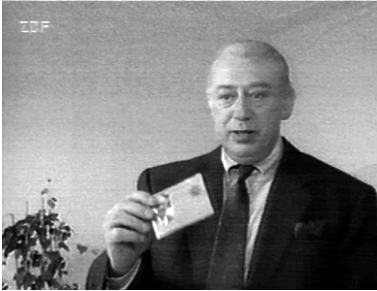
(Wie kriegen wir Bodetzky)

Die erste Szene in Der Schlüssel zeigt den im Büro sitzenden Derrick. Das Telefon klingelt, er nimmt den Hörer ab, die Kamera zoomt auf Nahaufnahme. Derrick blickt direkt in die Kamera und spricht zu dem Fernsehzuschauer: