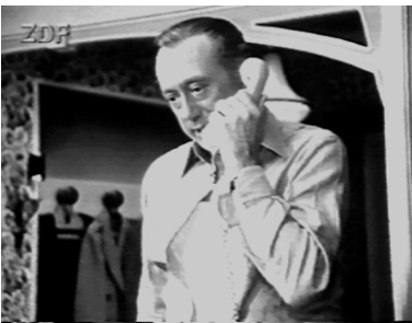
Dann aber: Harrys Anruf. (Pfandhaus)

ner Privatsphäre, beispielsweise bei der Ausübung eines Hobbies, gestört. Meistens ist er gerade dabei, sich etwas Einfaches zu kochen, allerdings nicht aus Spaß am Kochen, sondern schlicht des Hungers wegen.