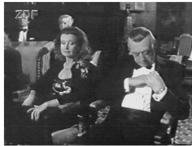
...ah, der Piepser!