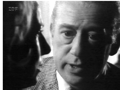
Derrick redet mal wieder ins Gewissen. (Die verlorenen Sekunden)

Konkrete Bezugspunkte finden sich denn auch reichlich in Derrick : Besonders auffällig sind die Führungsqualitäten in bezug auf junge Menschen, bei