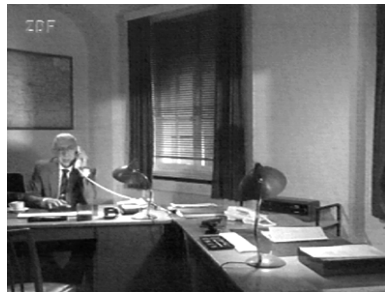
Nächtliche Telefonate: Natürlich dienstlich. (Teestunde mit einer Mörderin)

Oft sieht man ihn dann, wie er nachts alleine wartend im Büro sitzt oder in seltenen Fällen auch zu Hause Telefonanrufe entgegennimmt. Wird er zu Hause besucht, so wird er eigentlich nicht in sei-