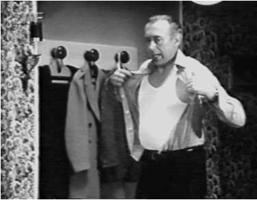
Die wilden Jahre: Ohne Hemd...