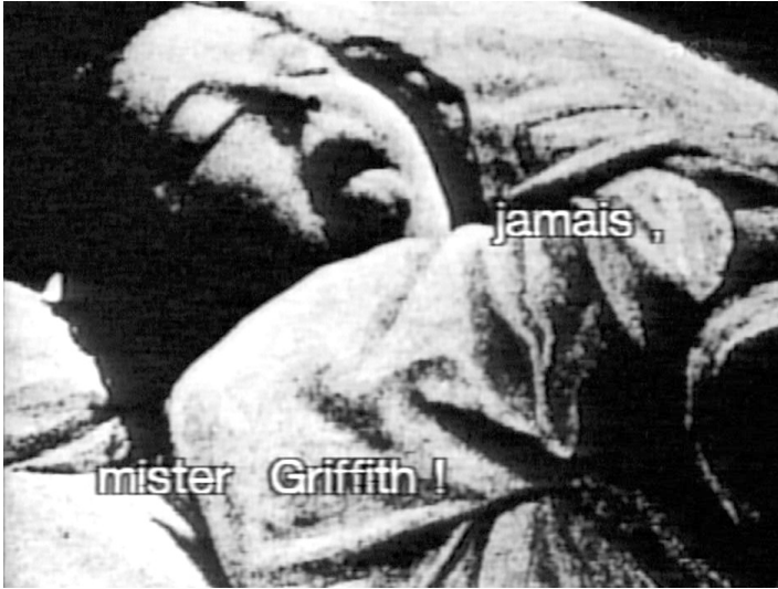
... und Augustine in der Salpêtrière

Das Gemeinsame, Verbindende zwischen den beiden Bildern verbleibt zunächst einmal dunkel und rätselhaft. Godard gibt einen Hinweis in der Dokumentation von Girard und Boujut, indem er fortfährt: „Es ist dasselbe Bild. Bonnel kann nicht sagen: ‚Interessiert keinen, wenn Sie von Freud sprechen‘. Es geht um die öffentlichen Transportmittel. Was ist Kino? Ein öffentliches Transportmittel der Gefühle. Darum geht es!“ Nun läßt sich nicht behaupten, daß dadurch der Bezug des einen Bildes zum anderen unbedingt klarer würde. Er spaltet sich schon im Zitat aus Une histoire seule in eine Vielzahl von Aspekten auf. Es ist in der Gegenüberstellung der Bilder eine zeitliche Koinzidenz angelegt – Freuds Traumanalyse und die Anfänge des Kinos –, ein unbestimmter gemeinsamer Bezug der Hysterie und des Kinos auf das Traumhaft-Unbewußte und auch ein Kommentar zur Technikgeschichte: Jean-Martin Charcot hat, wie Didi-Habermann ausführt 8 , seine Hysteriepatientinnen fotografisch dokumentiert, wobei das technische Medium der Fotografie gleichsam zu einem Mittel der Psychoanalyse wird, d.h. die Hysterie kann auf diese Weise klassifiziert werden. Das Medium Fotografie dient bereits in seinen Anfängen zum „Transportmittel“ (hysterischer) Gefühle, der Film setzt dies auf seine Weise fort. Lilian nimmt die Stelle von Augustine ein (beiden, der Hysterie in