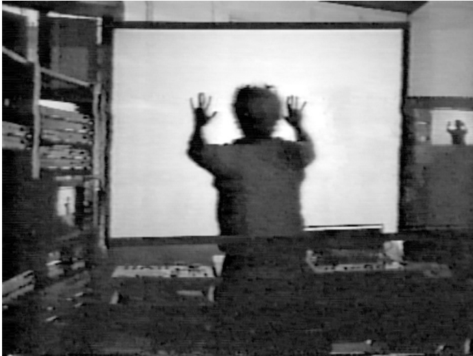
Godard in Scénario du film Passion

der Zuschauer Godard bei seiner Auseinandersetzung mit den filmischen Bildern über die Schulter.