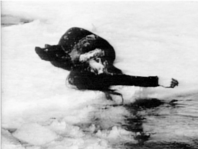
Histoire(s) du cinéma : Lilian Gish auf der Eisscholle ...

berichtet. 6 Dort hält er ein Foto von Griffith, „wie er eine seiner Großproduktionen dreht“, neben eine Aufnahme von Lilian Gish auf einer Eisscholle aus Way Down East (1920), dieses wiederum stellt er einem Bild gegenüber, das sich auf dem Titelblatt von George Didi-Hubermans Invention de l'hystérie befindet, „Augustine in der Salpêtrière“. Er kommentiert diese letzte Gegenüberstellung mit einem Text, der in Une histoire seule wiederkehrt: