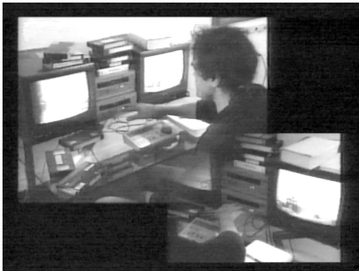
Farocki am Schnittplatz in Schnittstelle

In Schnittstelle sitzt Farocki an seinem Videoschnittplatz. Er reflektiert über den Video- und den Filmschnitt, über das Zueinanderfügen von Filmbildern, über die Filmarbeit, er zeigt Ausschnitte aus zahlreichen eigenen Filmen der Vergangenheit, kommentiert sie und stellt am Ende Pläne für einen zukünftigen Film vor. Dabei ist das Filmbild, das der Zuschauer zu sehen bekommt, geteilt: es sind immer zwei verschiedene Bilder zu sehen, die sich in der Mitte überschneiden, eines in der linken oberen Hälfte und eines in der rechten unteren Hälfte, meist ist das obere Bild etwas größer, aber nicht immer. Die Bilder sind auf eine schwarze Fläche gesetzt. Es ist dazu anzumerken, daß Schnittstelle eigentlich für die Präsentation in Form einer Installation aus zwei nebeneinander gestellten Bildschirmen gedacht ist und für die Ausstellung „Nach der Fotografie“ des Musée d'art moderne in Lille konzipiert worden ist. 2