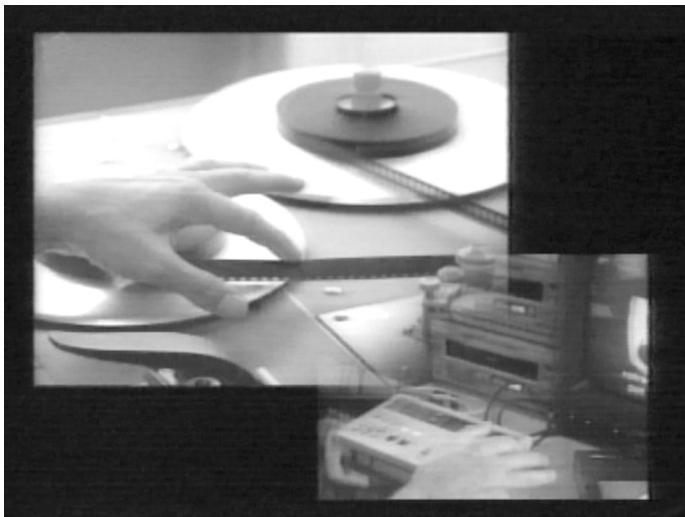
Schnittstelle bei Farocki ...

lustriert damit eine Äußerung Godards in einem Interview aus den achtziger Jahren: wenn ein Kalif ihn verurteilen würde und er wählen müßte, ob ihm zur Strafe das Augenlicht oder die Hände genommen würden, so wäre er lieber blind. 18 Die Äußerung ist natürlich nicht wörtlich zu verstehen, sondern als Form einer Reflexion des filmischen Sehens, die die Gleichung Sehen= Erkennen problematisiert und sie gleichzeitig an anderer Stelle, im Bereich der Montage, wieder etablieren helfen soll (vgl. oben: etwas wird in der Gegenüberstellung von Bildern sichtbar). Es ist aufschlußreich, daß nun auch Farocki im Zusammenhang mit dem Schnittplatz auf die haptische Dimension verweist und erklärt: „Bei der Arbeit am Filmschneidetisch lege ich die Fingerspitzen auf die ablaufende Film- oder Tonrolle, um die Schnitt- oder Klebestelle zu fühlen, bevor ich sie sehe oder höre.“ Dagegen werde bei der Arbeit mit Video das Band nicht angefaßt und stattdessen auf Knöpfe gedrückt: auch dies eine Arbeit der Fingerspitzen. Farocki demonstriert anschließend an einem Geldschein, „wie wenig das zusammenfällt, das Wesen und die Erscheinung“ – und ist damit an jenem Punkt angelangt, der auch bei Godards Reflexionen zentral ist: die problematische ‚Erkenntnisfunktion‘ des Sehens.