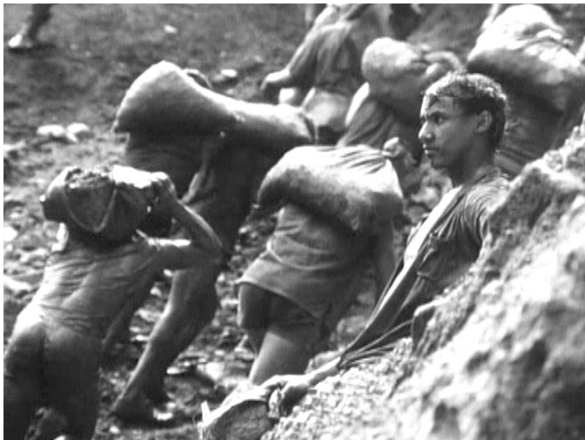
Koyaanisqatsi , Godfrey Reggio und Philip Glass 1983

Die hinzukomponierte Minimal Music kommentiert und ergänzt die dargestellten Bewegungsvorgänge und -tempi, Bildschnitte, Farben, Einstellungen und Lichtverhältnisse. Zudem lenkt der musikalische Verlauf, der durch die Wiederkehr und Kombination verschiedener Floskeln, Bewegungsrhythmen und Klangfarben zusammengehalten wird, die Wahrnehmung der Rezipienten. Die Wahl des jeweiligen Bewegungstempos, der Lautstärke und des Instrumentariums erzeugt trotz der distanzierenden Repetition bzw. Gleichmäßigkeit der Musik Assoziationen, die wiederum die gezeigten Bilder in eine veränderte Perspektive rücken. 21 In Powaqqatsi lassen sich deutlich vier akustische Wirkungsmittel unterscheiden: die Motorik der Repetitionen, das im Vergleich hierzu melodisch erscheinende Hauptthema, 22 die Klangfarben der Melodie- und Schlaginstrumente sowie die nur vereinzelt hörbaren Geräusche der im Film gezeigten Vorgänge (O-Töne). Die Varianz dieser Mittel und die von völliger Reduzierung bis zu voluminöser Addition reichende Ereignisdichte kon-