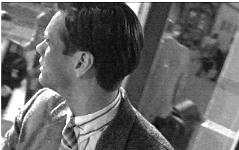
The Truman Show , Peter Weir 1998

musikalisch durchaus charakteristische Ausprägung hat, kann sie als Motiv, das zusätzlich außermusikalisches konnotiert, eingesetzt werden. Wie in den zuvor genannten Beispielen ist der minimalistische Stil auch hier reduziert auf eine repetitive Struktur, die lediglich die Klanglichkeit – nicht den Gesamtverlauf – prägt.