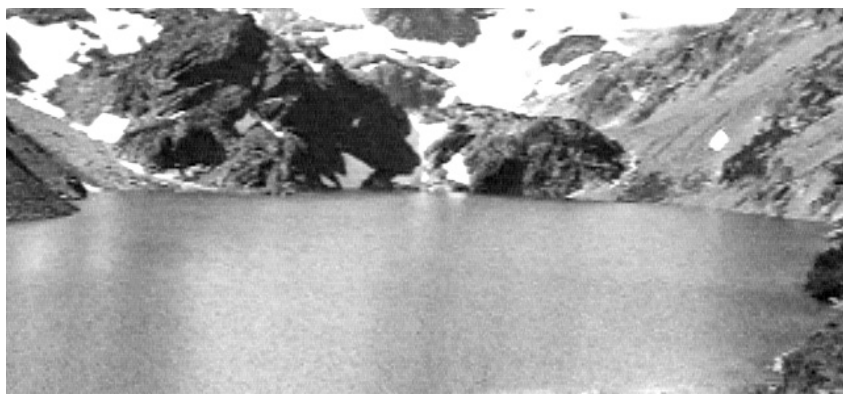
Kundun , Martin Scorsese 1997

werden. Die eng an die Minimal Music angelehnten Passagen dienen in Kundun vor allem der Abbildung sichtbarer Fortbewegung (Gehen, Reiten zu Pferd) und sind Landschaftsbildern, dem Element Wasser sowie entscheidenden Ereignissen, die sich überwiegend ohne Worte vollziehen, zugeordnet. Neben Repetitionsfolgen, die als minimalistisch zu klassifizieren sind, 16 verwendet Glass kurze Motive, deren melodische Gestalt traditionellen Mustern ähnelt, sowie Liegeklänge oder akzentuierende Schläge. All diese musikalischen Elemente, die im Laufe des Films zu motivischen Bausteinen werden, setzt Glass in frei kombinierender Weise ein. So steigert er beispielsweise das klangliche Geschehen bereits zu Beginn des Films durch die Kombination mehrerer