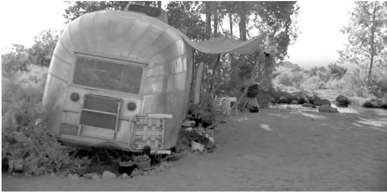
Trial & Error (1997)

Zweck anpaßt. 28 Dies bedeutet nicht nur eine Leichtbauweise, die sowohl bei der Architektur als auch beim Autobau Anleihen macht, sondern insbesondere eine lose Struktur von Elementen, deren kategorische Transformation, Mobilität, und Wegwerfcharakter erst das Wohnmobil möglich machen. So wird aus einem Eßtisch mit Sitzbank ein Bett, eine Truhe, ein Zeichenbrett, oder aus einem Bad eine Dusche oder Geschirrspülmaschine.