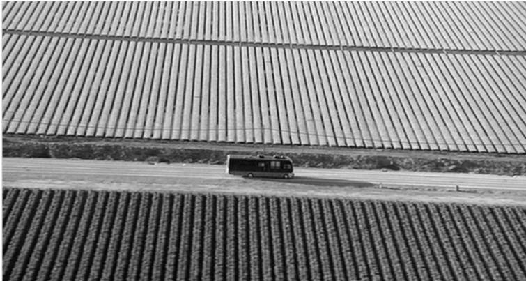
Meet the Fockers (2004)

lende Haus. Alles geht vor sich, als gebe es keine Geschichte vor den Nachrichten der letzten 48 Stunden. 7 Die Fernstraße ist die archetypische Landschaft des medialen Nirgendwo, nicht einmal „in the middle of nowhere,“ sondern geographisch ständig verschoben. Der gutsituierte Witwer (Jack Nicholson), der seinen Winnebago Adventurer in About Schmidt von Omaha, Nebraska nach Denver, Colorado fährt, will sein großes, leeres Haus zurücklassen und sich selbst finden, und erfährt doch nur die monotone Landschaft des mittleren Westens und des einsamen Alterns. Allerdings muß man dagegenhalten, daß jede Strecke ihre Geschichte hat, die durchaus zugänglich und archiviert sein mag, auch wenn sie oberflächlich nicht mehr bietet als Langeweile und Isolation – denn sie mag, solange zwischen hier und dort kaum mehr spürbare, sichtbare Unterschiede bestehen, im gleichen Ausmaß mit Arbeit und Seßhaftigkeit assoziiert sein, als Pendler-Landschaft. 8