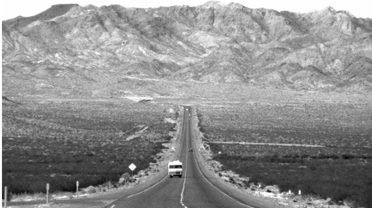
Lost In America (1985)