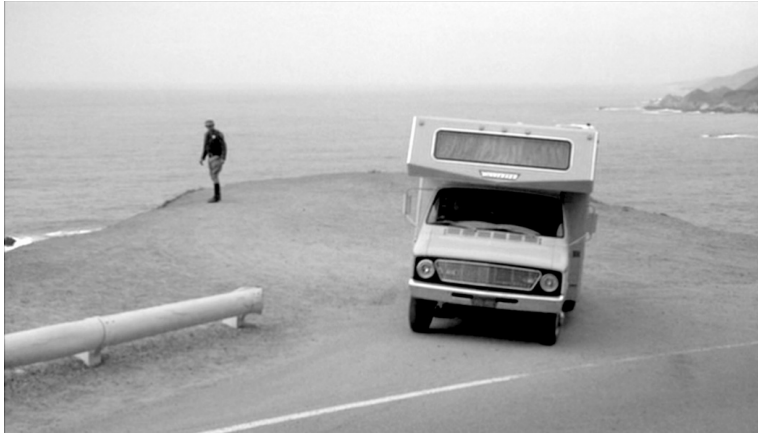
Escape to Witch Mountain (1775)