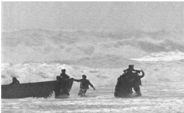
Balanceakt zwischen Immersion und Beobachtung