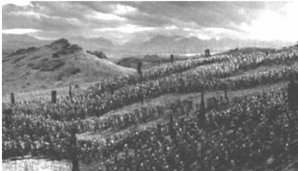
Ein Schatten über der Landschaft: die Erdgeschöpfe der Orks und Urukai

Die imperiale Imagination des Verhältnisses von „Mensch“ und „Natur“ wird durch die graduelle Abstufung verschiedener Geschöpfe zwischen Mensch, Tier und Pflanze ausgesponnen. Figuren wie Treebeard, der weise Alte in Baumgestalt, oder die filigranen Elben und ihr gewachsener Lebensraum zeigen, daß die Pflanzenwelt in LOTR eine Brücke zwischen „Natur“ und „Kultur“ schlägt und das Bild einer positiven Interaktion zwischen beiden erzeugt, wohingegen das Animalische den Anschein eines naturfeindlichen kulturellen Phänomens bekommt. Zwar gehen Orks und Urukai wie in zahlreichen Schöpfungsmythen direkt aus dem Schoß der Erde hervor, doch ist dieser Akt nur als Folge einer aggressiven Zerstörung der Waldlandlandschaft möglich. Die natürliche Landschaft der Trilogie ist eine Pflanzenwelt, zu deren Rettung im Finale des zweiten und dritten Teils verschiedene Kulturen im Verbund mit Pflanzenwesen gegen ein animalisch-industrielles Imperium antreten.