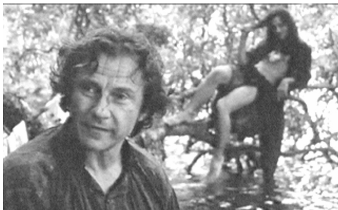
Idylle in Maoriland

sibilität markieren seine Nähe zur Natur, im Unterschied zu Stewart, mit dem er um Adas Zuneigung konkurriert: „While never relinquishing his whiteness, he is able to arouse Ada’s passions because he is closer to nature than Stewart“. 30 So formen die Landschaftsbilder von The Piano den notwendigen Bezugsrahmen einer „maorischen Natur“, in dem das Paar zueinander finden kann. 31