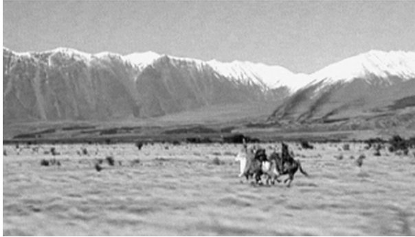
Unterwegs im Kampf für die Landschaft