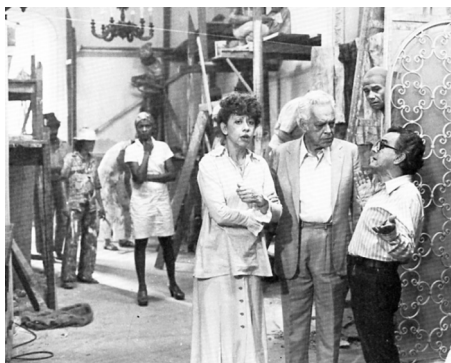
Boca de Ouro