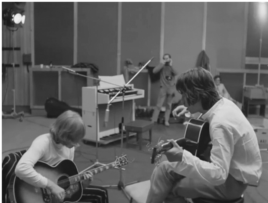
Abb. 4: Arbeit (ONE PLUS ONE) (Farbabb. s. Anhang).

der weißen Kulturindustrie, vom Blues der versklavten Afrikaner zum ‚tollen Popsong und Hitparadenstürmer‘. Das jedenfalls ist der Weg, den LeRoi Jones in seinem Buch Blues People beschreibt, wenn er die Geschichte der afroamerikanischen Bevölkerung der USA als einen Weg durch die Musikgeschichte entwirft: vom Sklaven zum Popstar, zum Akteur innerhalb der Kulturindustrie. 11 In der lecture performance auf dem Schrottplatz steht dieses Buch am Anfang.