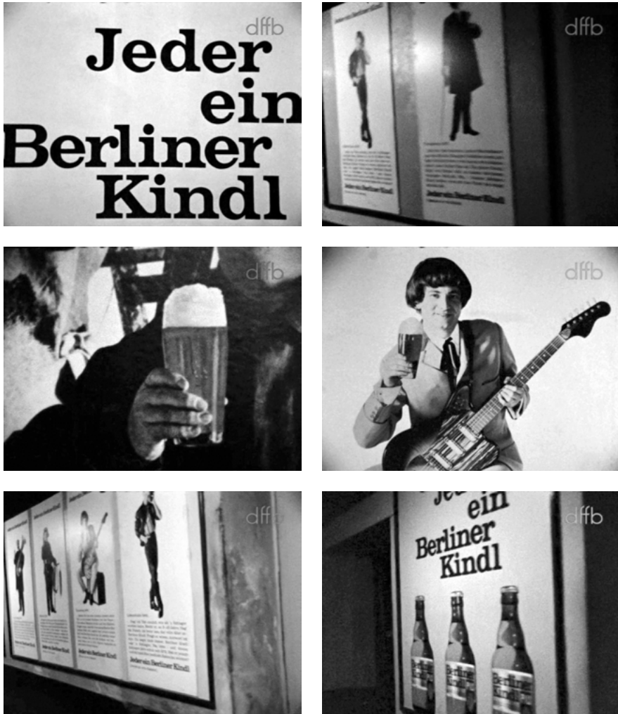
Abb. 7: Harun Farocki: JEDER EIN BERLINER KINDL (BRD 1966).

Stimme aus dem Off (Farocki selbst) erklärt in betont neutralem Ton, in welchem Kontext die Plakate zu sehen sind. Nahtlos, ohne den Tonfall zu ändern, geht der Kommentator dazu über, einen Ausschnitt aus den Werbetexten vorzulesen: