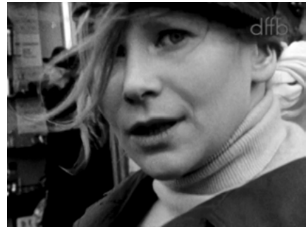
Abb. 8: Helke Sander: SUBJEKTITÜDE (BRD 1967).