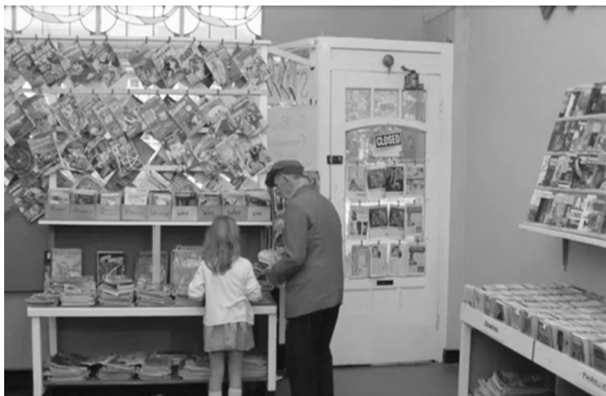
Abb. 6: Schundliteratur (ONE PLUS ONE) (Farbabb. s. Anhang).

„glasklar-stahlharten Logik des nächsten Schrittes“, sondern noch den Möglichkeiten dialektischer Synthese eine Absage erteilte.