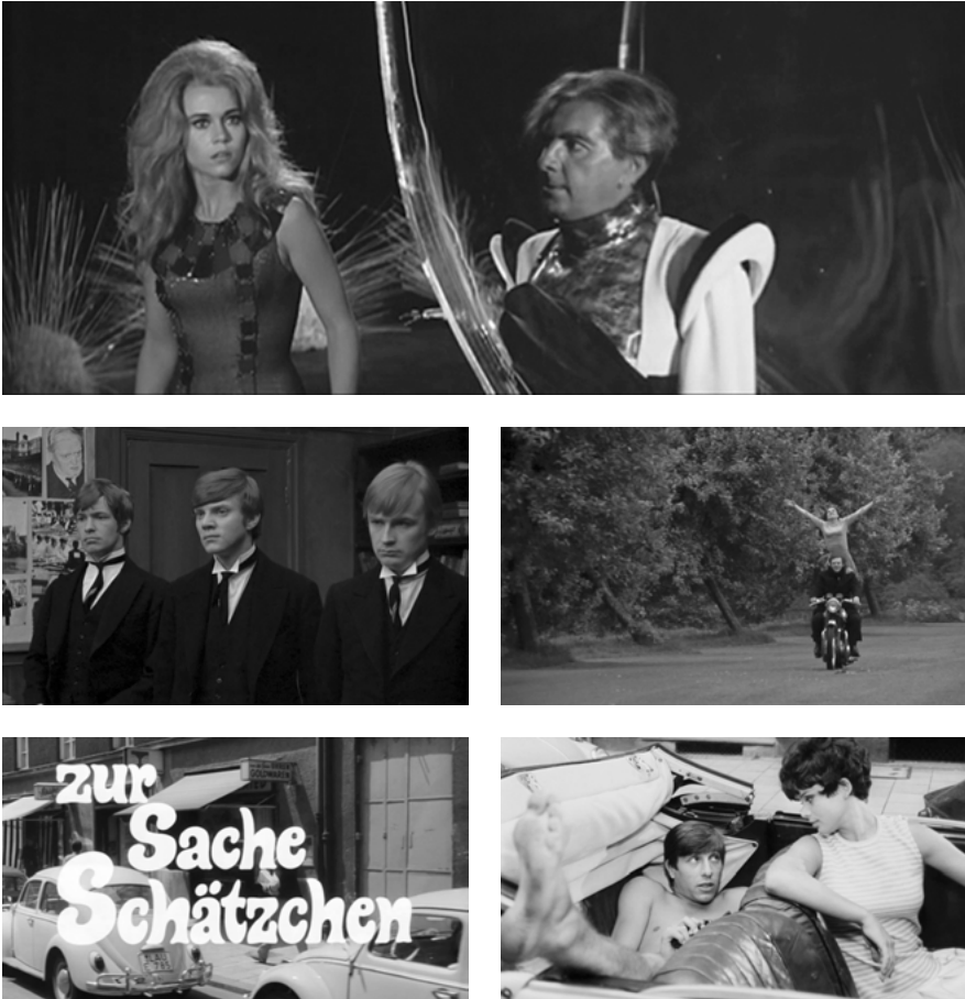
Abb. 3: Hymnen an die Freude des Jungseins: BARBARELLA, IF...., ZUR SACHE, SCHÄTZCHEN (Farbabb. s. Anhang).

Stelle von Traditionen und Institutionen getreten, die als generative Elemente kultureller Gemeinschaftsbildungen fungierten. Der Look, der geteilte Musikgeschmack, der richtige Verhaltensstil haben den Platz der alten gemeinschaftsbildenden Instanzen eingenommen, die da waren: das Volk, der Clan, die Klasse, die Rasse, das Milieu und die Religion.