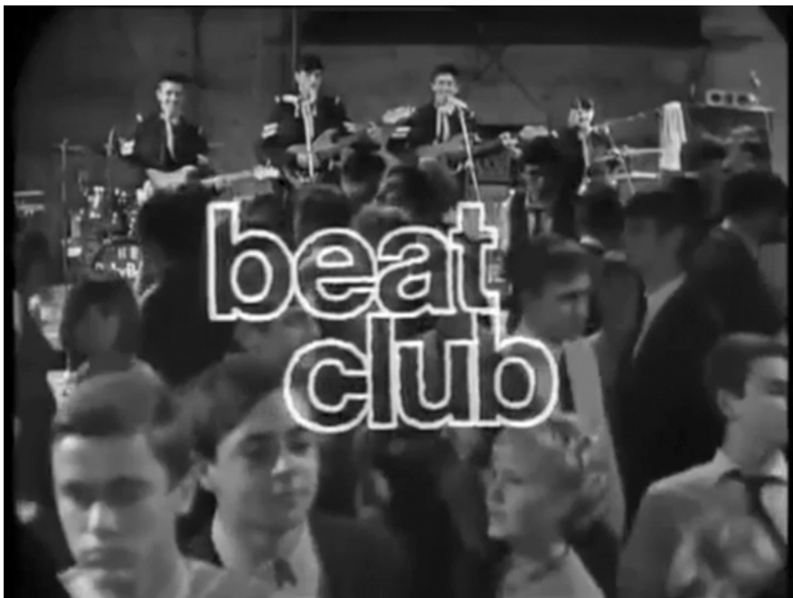
Abb. 1: Sendung mit Kultstatus bei Jugendlichen.

man musikalisch die Schlagerparade noch nicht wirklich vom Beat Club unterscheiden konnte. Man bekam es irgendwie mit, wenn auch eher im Sinne eines Spektakels, an dem etwas nicht ganz geheuer, nicht normal, ja asozial war. Trotzdem träumte dann der 12-Jährige davon, endlich nicht mehr zum Friseur zu müssen.