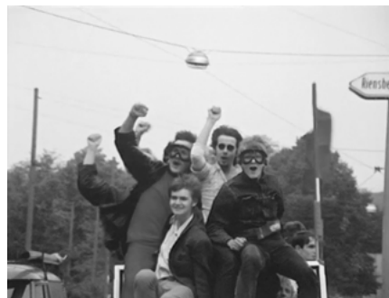
Abb. 2: Leichthändige Pop-Art-Revue (Farbabb. s. Anhang).