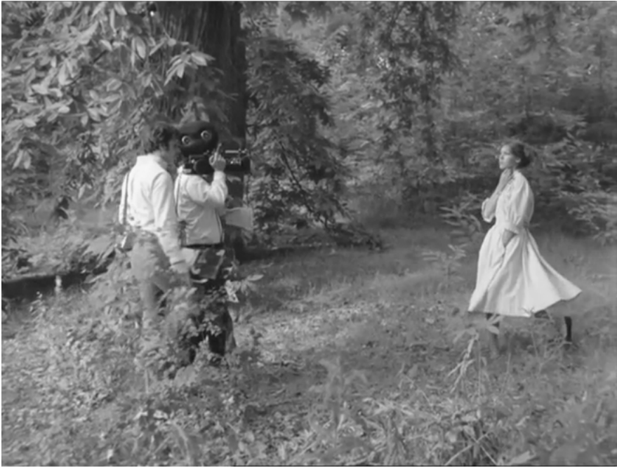
Abb. 5: Eve Democracy (ONE PLUS ONE) (Farbabb. s. Anhang).

Eine Szene wie das Frühlingsgedicht eines Primaners – aber was wie ein Interview daherkommt, das die Allgemeinplätze zeitgenössischer Politik abfragt, gleicht dann doch eher einer Jagdszene. Die Frau, ihr Name Eve Democracy, entkommt den Reportern nicht, will auch nicht so recht ... ihre Antworten aber erschöpfen sich im Ja oder Nein.