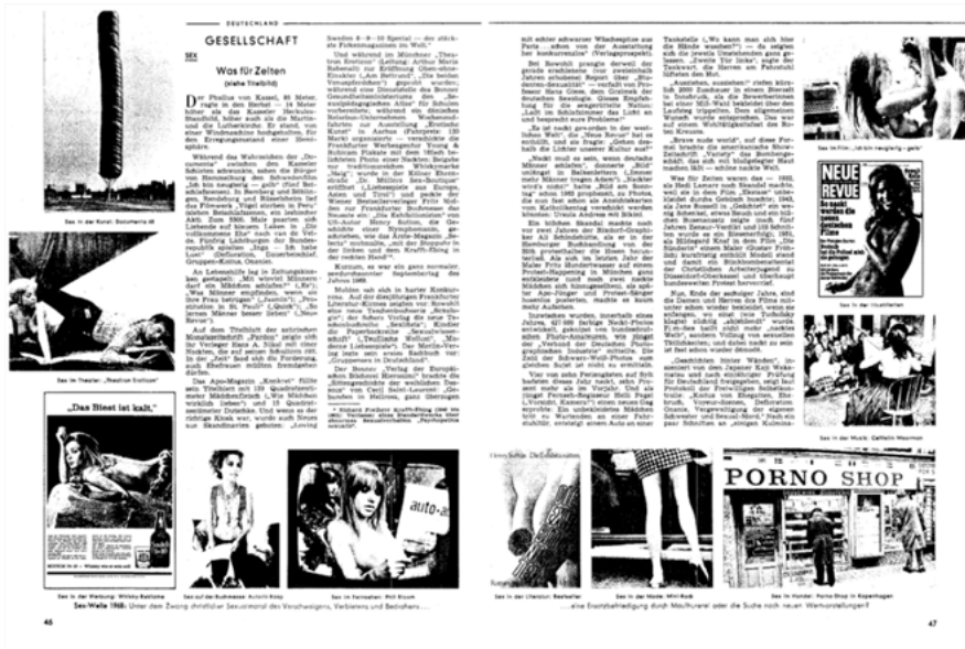
Abb. 6: Spiegel der massenmedialen „Sex-Welle“.

eine von mehreren „Lärm und Sex-Einlagen“, 24 was als ‚Busenattentat‘ in die Geschichte der biografisch-philosophischen Hintertreppen 25 eingehen sollte: „Vor knapp zwei Wochen ließen drei taktisch entblößte Frankfurter Genossinnen seine Vorlesung platzen.“ 26 Ein knappes halbes Jahr zuvor war in einer Titelgeschichte des gleichen Magazins schon über die „Sex-Welle 1968“ zu lesen, wobei „ein ganz normaler, sexdurchsonnener Septembertag 1968“ 27 aufgespannt wurde als Panorama zwischen Kunst (Christos 5600 Cubicmeter Package auf der documenta ), Buchmesse (die Frankfurter, mit neuen Buchreihen wie „Sexologie“ und „Sexlibris“) und Werbung (mit einer nackten Frau für Whisky) (Abb. 6). Entscheidend ist: die Omnipräsenz der Sexualität war an erster Stelle eine (massen-)mediale – nicht direkt eine Frage real gelebter Sexualität, sondern zunächst eine der „Flut des verflochtenen Sex“. 28 Ador-