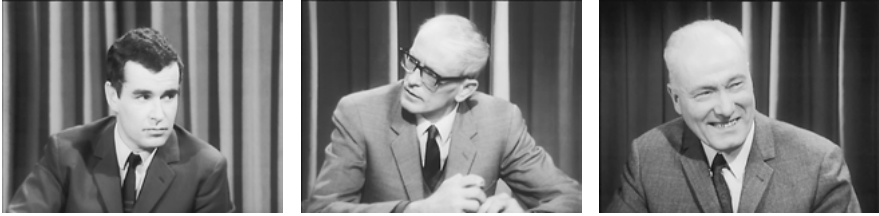
Abb. 4: Markante Reaktionen im totalisierten Expertenraum.

recht selbstgenügsames Verweisgefüge unter und zwischen den Gesprächspartnern. Oder besser: unter den Gesprächs- oder Sprecherpositionen, die in der strikten, wie vorgestanzten Verteilung und Abfolge den filmischen Raum zwischen sich aufspannen. Noch die Benennungen und ihre Dopplungen, die Benennungen als Dopplungen sind Teil dieses Gefüges, in dem erst die Stellen der Männer in der Wissenschaft zu ihren autoritären Stellungen im Film werden.