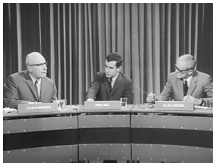
Abb. 5: Vortrag ins Nichts.

auch: „Im Jahre 1968 [...]“, und zwar in der letzten Nahaufnahme des Vortragsabschnitts und so durchaus auch als sein Kulminationspunkt.