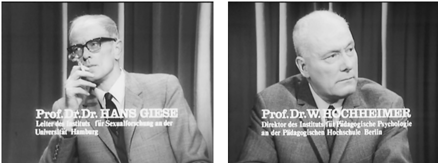
Abb. 2: Experten mit gewichtigen Positionen.

kumsansprache formuliert Kolve: „Dieses Gespräch ist für Sie notwendig, damit Sie die spätere Darstellung intimster Vorgänge verstehen.“ Zwischen ‚belehrend‘, ‚moralinsauer‘, ‚missionarisch‘ einerseits und ‚Schein-Seriosität‘, ‚Deckmantel‘, ‚Vorwand‘ andererseits lässt sich solche Wissenschaftlichkeit natürlich säuberlich qualifizieren – und dann auch ihr Generisch-Werden in diesen Koordinaten begreifen. 8 Die ersten SCHULDMÄDCHEN-REPORTS zeichnen sich zum Beispiel durch einigen Einfallsreichtum aus, wenn es darum geht, Verweise auf vermeintlich redliche Publikationen zu machen und (hier von Schauspielern dargestellte) Experten einzuführen, vor allem Psychologen (Abb. 3). Die Fadenscheinigkeit dessen erscheint dabei durchaus als Teil des Wirkungskalküls – ist die Wissenschaftlichkeit als Mittel einmal gefunden, lässt sie sich