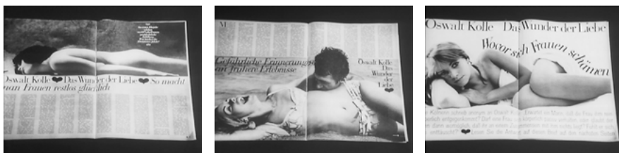
Abb. 8: Berichte mit millionenfachem Echo.

likationen und hintere Seitenflächenkanten durch Kolles Oberkörper besorgt werden.