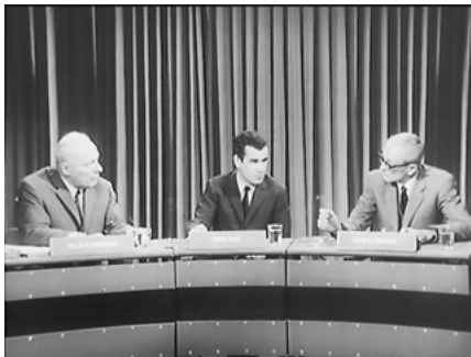
Abb. 1: Oswald Kolle nebst Professoren ohne Unterleib.

fasst zwischen dessen vertikal-lamellenartiger Hell-Dunkel-Textur, die den Hintergrund des Schwarz-Weiß-Bildes stellt, und einem nach vorn im horizontalen Hell-Dunkel-Wechsel verkleideten Tisch, der mit flacher Kurve in die Bildtiefe ragt, sitzen die Experten (so etabliert es die erste Einstellung der Szene (Abb. 1)).