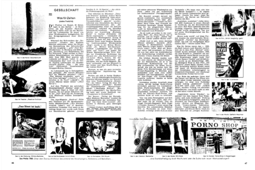
Abb. 6: Spiegel der massenmedialen „Sex-Welle“.

eine von mehreren „Lärm und Sex-Einlagen“, 24 was als ‚Busenattentat‘ in die Geschichte der biografisch-philosophischen Hintertreppen 25 eingehen sollte: „Vor knapp zwei Wochen ließen drei taktisch entblößte Frankfurter Genossinnen seine Vorlesung platzen.“ 26 Ein knappes halbes Jahr zuvor war in einer Titelgeschichte des gleichen Magazins schon über die „Sex-Welle 1968“ zu lesen, wobei „ein ganz normaler, sexdurchsonnener Septembertag 1968“ 27 aufgespannt wurde als Panorama zwischen Kunst (Christos 5600 Cubicmeter Package auf der documenta ), Buchmesse (die Frankfurter, mit neuen Buchreihen wie „Sexologie“ und „Sexlibris“) und Werbung (mit einer nackten Frau für Whisky) (Abb. 6). Entscheidend ist: die Omnipräsenz der Sexualität war an erster Stelle eine (massen-)mediale – nicht direkt eine Frage real gelebter Sexualität, sondern zunächst eine der „Flut des verflochtenen Sex“. 28 Ador-