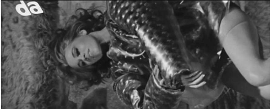
Abb. 1: Striptease in der Schwerelosigkeit.

Eine Liebesszene, ganz klar – doch wer sind die Beteiligten, wer bringt da zusammen die Planeten zum Stillstand? Inszeniert der Film vielleicht einen Flirt zwischen Barbarellas nackten Extremitäten und dem Blick der Zuschauerinnen und Zuschauer? Dazu kommt es nicht. Die Affizierung durch Komik und Nonsense hält die Erotik in Schach, zelebriert sie dafür auf eine seltsame Weise, der ich im Folgenden nachgehen möchte. Dazu gehört, dass Barbarellas schwerelosere Striptease an den Zeitlupen-Fall von Carrolls Alice durchs Kaninchenloch denken lässt – zumal Barbarella nach der Sequenz mit einem Plumps auf dem teddybärbraunen Kunstfell landet, mit dem ihre Raumkapsel ausgestattet ist.