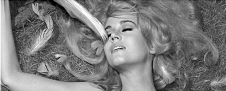
Abb. 3: Barbarella im Engelsnest.