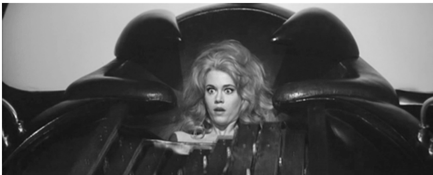
Abb. 5: „It’s ... sort of nice, isn’t it?“

sanften Stimme des Bösewichts: „Wait until the tune changes. It may change your tune as well.“ (Abb. 5)