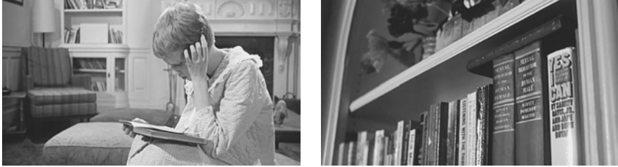
Abb. 3: Unstimmigkeiten in der Hausbibliothek.

Rassen- und Klassendiskriminierung geprägte Lebenserfahrung eines berühmten afroamerikanischen Musikers ein Regalbrett mit den Erfolgsgeheimnissen und Selbstanalyse-Hilfen eines Psychotherapeuten. Jener Querschnitt durch die eklektische Hausbibliothek des amerikanischen Durchschnittsbürgers ist selbst ein Anagramm, eine Permutation tabuisierter und schließlich normativierter, zum ‚guten Ton‘ etablierter Diskurse. In dieser Perspektive ist auch das Wohnzimmer mit seinem Bücherregal nicht weniger als eine Gerüchteküche, deren Ausstattung das nötige Populärwissen für die nächste Dinnerparty bereithält.