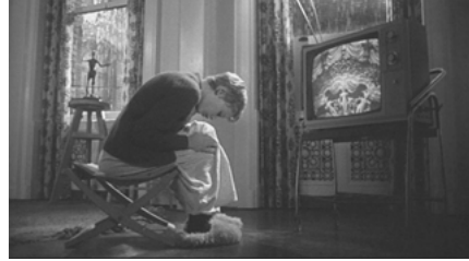
Abb. 4: „Baby Nights“.

es allerdings wohl keinen Zeitpunkt und keinen Ort, der beliebiger sein könnte – sowohl für einen Papstbesuch als auch für das, was Guy im Film salopp als „baby night“ bezeichnet. Und tatsächlich ist er es auch, der, während er in einer Einstellung das Oberhaupt der katholischen Kirche auf dem Fernsehbildschirm betrachtet, nicht die religiöse Geste, sondern das Medienereignis sieht – als Werbefläche, an der man seinen neuesten Yamaha-Spot besonders lukrativ platzieren könnte (Abb. 4). So gesehen ist Rosemarys Baby am Ende eben auch nichts weiter als eines von vielen Zeichen, die potentiell bedeutungsvoll, dann aber sinnentleert, sinnwidrig, oder unsinnig daherkommen; ein Katalog- oder Magazinbild, eine Figur in einer Weihnachtskrippe, ein Name aus einem Buch, oder ein beim Essen mit Freunden gestreutes Gerücht. Wenn auch kein Hauch des revolutionären Geistes der 1960er Jahre durch das Manhattan dieses Films (und dieses Buches) weht, dann ist es immer noch der bis heute nachwirkende Atem einer Zeit und einer Gesellschaft, in welcher der Versuch, Zeichen zu setzen, oft nicht über die Groteske des ‚Zeichentricks‘ hinausging: