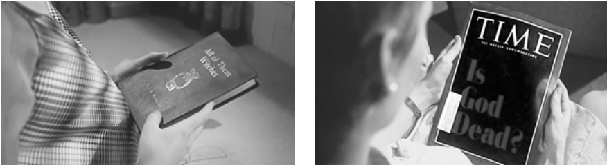
Abb. 1: Zwei Titel, eine Meinung.