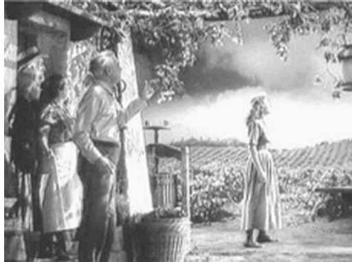
Aber das letzte Wort hat die Idylle.

sem Film die beiden Figuren (z. B. durch gemeinsame äußere Kennzeichen wie den Oberlippenbart) eher, in einer überdimensionalen Parallelmontage, als Repräsentanten einander ergänzender menschlicher Verhaltenstypen gestaltet denn als Antagonisten. Hinter der Großspürigkeit und dem lächerlichen Imponiergehabe Hynkels erscheinen das negative