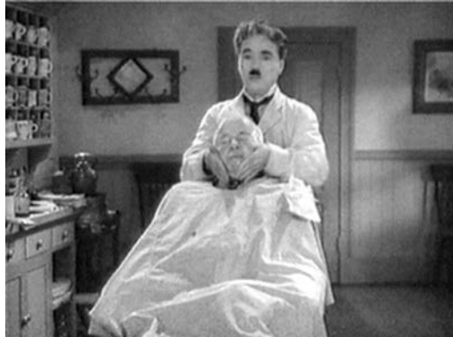
Kopf und Globus: Klammerfunktion der Bildgestaltung

Daneben gibt es, um das Erzählgeflecht noch geschlossener zu gestalten, vielfältige symbolische Bezüge zwischen den beiden Handlungssträngen – etwa ein lang eingeblendeter Käfig mit einem Kanarienvogel, während die beiden Liebenden Hanna und Charlie 14 als Quasi-Gefangene auf dem Dach Zukunftspläne machen, die Parallelsetzung der beiden tänzerisch-musikalischen Einlagen, des symbolischen Spiels mit der Weltkugel und der Rasur im Takt des "ungarischen Tanzes" im Friseurladen, die unmittelbar aufeinander folgen, oder Bildklammern wie Kopf und