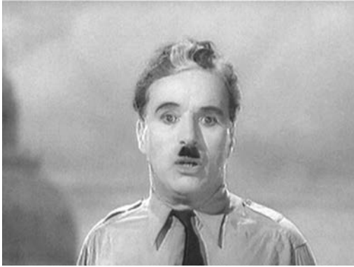
Die Stimme des Charles Spencer Chaplin ...