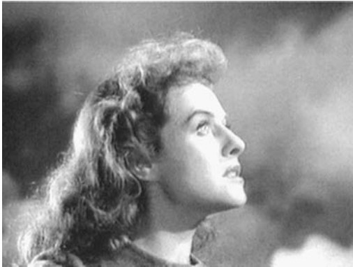
... ertönt vom Himmel

und spricht nur noch für sich selbst. 18 Auch wenn durch das Schlußbild der Versuch gemacht wird, sie aufrecht zu erhalten: zu nachhaltig ist die Kinokonvention durch diese Szene gestört, als daß das zuhörende Mädchen anders aufgefaßt werden könnte denn als Inkarnation eines abstrakten Adressaten, der erst im Kino als Publikum konkret anwesend sein wird.