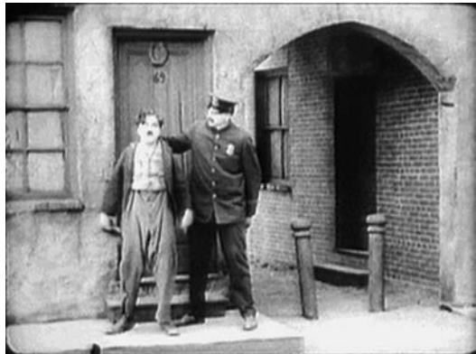
... aber das Erwachen ist in Wirklichkeit die Rettung