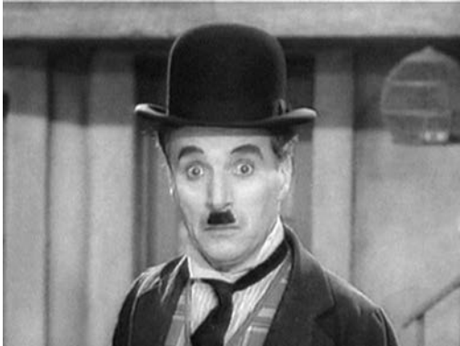
Doppelgänger: Der jüdische Friseur ...