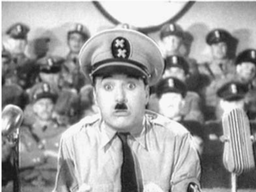
... und Hynkel, der Diktator

schen Botschaft, der Propagierung des amerikanischen Kriegseintritts. Nun aber strebte er bewußte Parteilichkeit an. Das hatte zunächst zur Folge, daß dieser Film, im Gegensatz zur grundsätzlich additiven oder kreisförmigen Dramaturgie seiner übrigen Filme, eine Handlung im Sinne einer Entwicklung aufweist. Bestand in seinen frühen Filmen am Schluß dieselbe Situation wie am Anfang, war der Tramp bereit zum nächsten Abenteuer bzw. Film, so wird am Ende von The Great Dictator der Diktator gestürzt, die Menschheit geläutert werden. Die Veränderungen, die im Verlauf der Geschichte passieren, sind irreversibel.