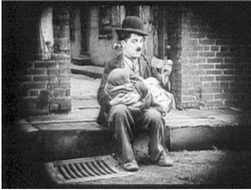
Charlie findet ein Kind ...