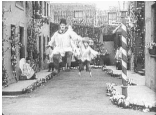
... träumt, kann fliegen ...