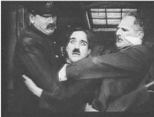
... und bald wird es ihm weggenommen