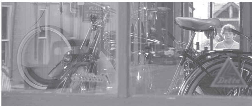
HEARTS IN ATLANTIS (USA 2001, R: Scott Hicks).

Diese Zeitkonstruktionen laufen zusammen in der wiederkehrenden Szene, in der Bobby vor dem Schaufenster eines Geschäftes steht und mit sehnsuchtsvollen Augen ein sich gleichmäßig im Uhrzeigersinn drehendes Fahrrad bewundert, das zum Sinnbild bewusst erlebter Zeitlichkeit wird (siehe unten).