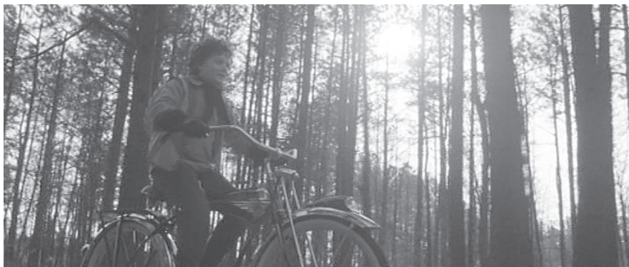
HEARTS IN ATLANTIS (USA 2001, R: Scott Hicks).

Das dämmernde Tageslicht weist ebenso wie die Jahreszeit Winter auf einen temporalen Übergangsmoment hin. Die tief stehende Sonne erscheint als Lampe der filmischen Projektion, die in der verlangsamtten Bewegung des Fahrrads bzw. der Kamerafahrt durch die winterlich kahlen Bäume einen stroboskopischen Effekt anschaulich macht, der Grundlage der filmischen Illusion von Bewegung ist. 15 Einzelne Bilder werden hier im retrospektiven Blick aus ihrem filmischen Bewegungszusammenhang herausgelöst. Das Medium Film wird (analog zum Fahrrad) als Zeitmaschine erkennbar, die Erinnerung als filmischer Prozess, der Erinnerungsträger als Erzählinstanz, die die filmische Bewegung der Bilder bedingt. Zu Beginn des Films ist der erwachsene Bobby zu sehen, der als professioneller Fotograf chronofotografische Serienaufnahmen einer Fahrradfahrt erstellt.