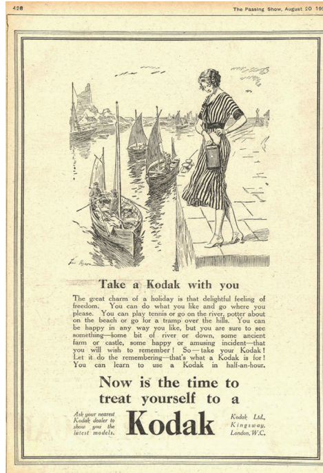
11.3 – Kodak Anzeige aus der Zeitschrift The Passing Show (1921), Illustrator: Fred Pegram

So verwundert es nicht, dass gerade für die ersten Kleinformatkameras primär Frauen als Werbefiguren eingesetzt wurden. Eindringlichstes Beispiel ist wohl die Eastman Kodak AG mit ihrer Werbeikone des Kodak Girls, die ab 1888 bis in die 1960er Jahre flächendeckend (auch in den deutschen Anzeigen) zum Einsatz kam. 32