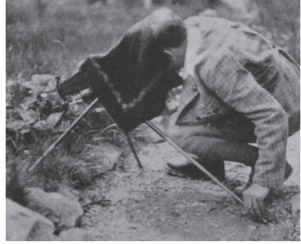
11.1 und 11.2 – Fotobeilagen aus Alexander Niklitschek, „Geknipste Knipser“, in: Photographische Rundschau und Mitteilungen (1931)

Die Fotografien zeigen jeweils einen Fotografen, der mithilfe eines Dreibeins Nah- bzw. Großaufnahmen am Wegesrand bewerkstelligt. Anhand der Körperhaltungen und des Umgangs mit dem Zubehör bewertet und vergleicht Niklitschek die jeweiligen fotografischen Kompetenzen: