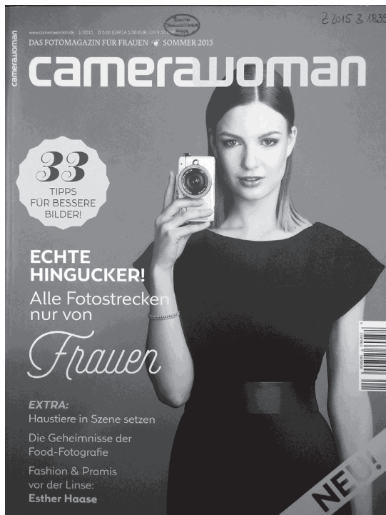
11.5 – Cover der ersten Ausgabe der Zeitschrift camerawoman (2015)

Anhand der besprochenen Beispiele aus der historischen AmateurfotografInnen-Bewegung der 1920er und 1930er Jahre konnte gezeigt werden, wie jeweils über den fotografierenden Körper Geschlecht konstituiert wird. Der fotografierende Körper offenbart sich als ein interessanter Untersuchungsgegenstand für Fragen nach dem Körper als Wissensspeicher von sozialen Normen, da beim Fotografieren zum einen auf Routinen zurückgegriffen wird, die auf ein implizites Wissen und gesellschaftliche Strukturen verweisen und zum anderen im unmittelbaren Umgang mit der Fotoapparatur ein Komplex aus Körper-Technik-Relationen zum Tragen kommt, der gerade für Materialisierungsprozesse von Geschlecht relevant ist. In den untersuchten Diskursen zeigte sich eine konsequente Vergeschlechtlichung fotografischer Praxis, sobald die Frau als Fotografin thematisiert wird. Hierbei dienen geschlechtsstereotype Körpereigenschaften als Bewertungsmechanismen bezüglich der Qualität fotografischer Tätigkeiten. Gerade mit der Entwicklung und Verbreitung mobiler Kleinformatkameras wird die Frau zunehmend als Konsumentin interessant, jedoch in der idealisierten Vorstellung einer modisch bewussten Fotografin, wobei der Fotoapparat lediglich als Accessoire eine Rolle spielt.