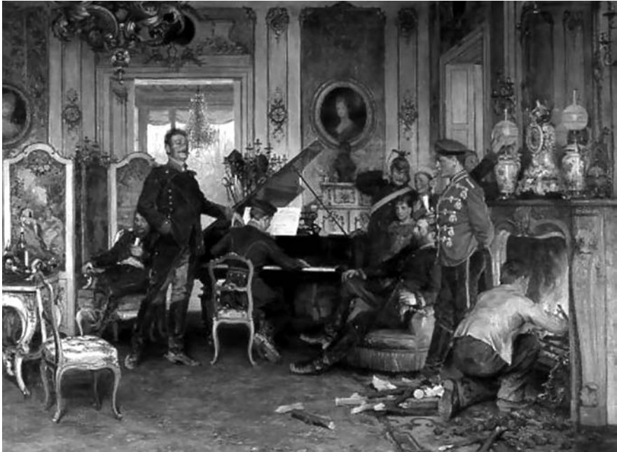
Abb. 2: Anton von Werners Historiengemälde Im Etappenquartier vor Paris (1894)