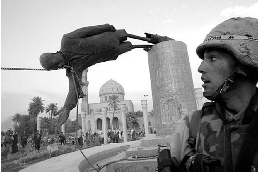
Abb. 3: Firdos Square, Bagdad (Foto: Goran Tomasevic, 9.4.2003)

Somit ist verständlich, dass der Sturz solcher Statuen vordringliches Ziel der neuen Machthaber ist. Mit der Zerstörung der Statue wurde also auf semantischer und symbolischer Ebene die Herrschaft Saddam Husseins offiziell beendet. Auch Sensche nennt als wichtigste Zäsur, neben dem Angriff auf den Irak, den 9. April 2003, den Tag der Einnahme Bagdads und des Statuen-Sturzes auf dem Firdos Square . 24