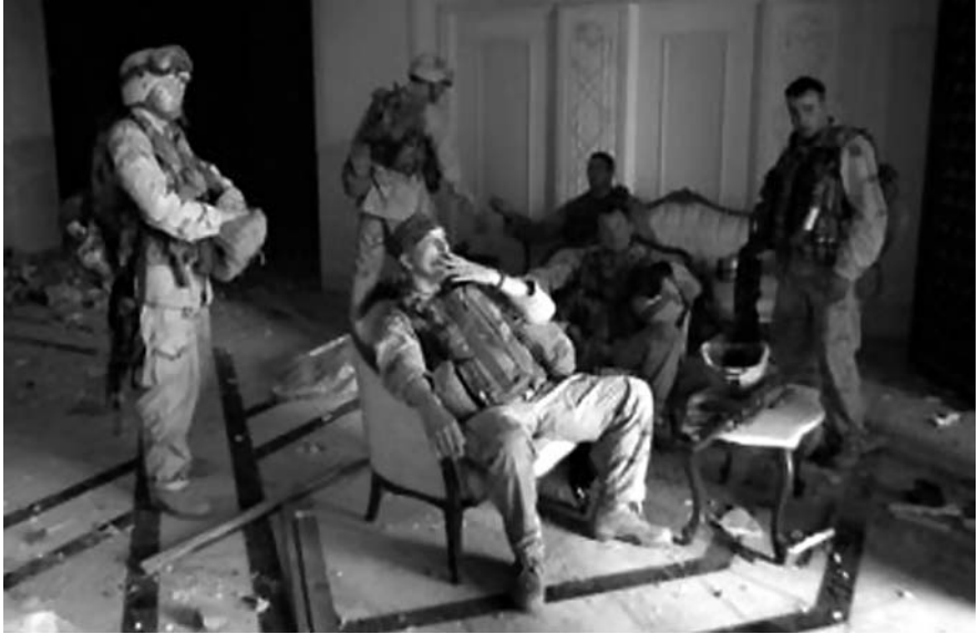
Abb. 1: Palast der Republik (Foto: John Moore, 7.4.2003)

zu Ikonen werden können. 10 Um die Inszenierung einer solchen Siegesikone ging es auch im Palast der Republik.