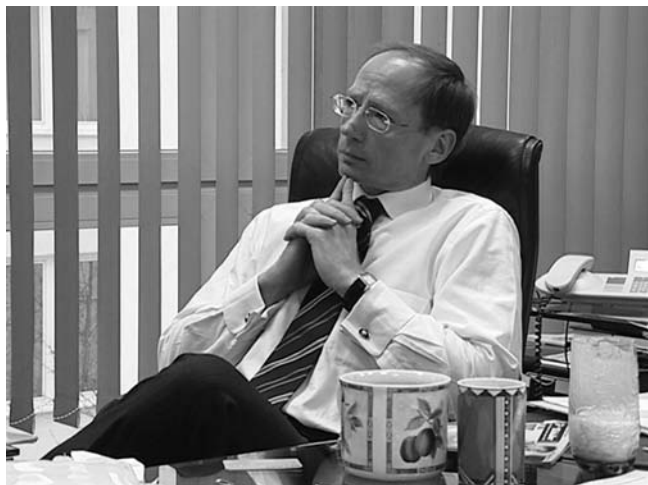
Abb. 2: Film als ›Bild-Denk- Molekül: Das nach- denkliche Gesicht des Verhandlungsführers wird zur Projektionsflä- che für Gedankengänge des Zuschauers (NICHT OHNE RISIKO (D 2005))

«Die Akteure [...] sind geistesgegenwärtig und voller Darstellungslust. Sie verhandeln, zu welchen Konditionen 750.000 Euro vergeben werden sollen. Nachdem sie sich zunächst nicht einigen können, weichen sie auf ein allgemeines Gespräch über strategische ›issues‹ aus. Da wird deutlich, dass die NCTE, Hersteller von berührungslosen Drehmoment-Sensoren, schon mit großen Firmen im Gespräch ist. Und das entzündet die Phantasie, die Welt ist voller Möglichkeiten und es ist eine Lust, diese abzuwägen.» 15