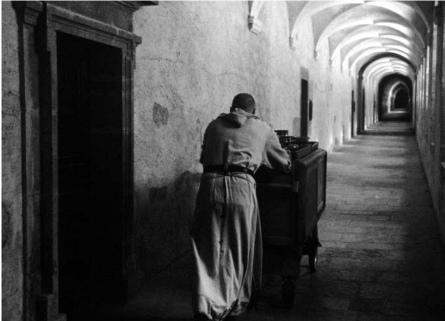
Abb. 5: DIE GROSSE STILLE (2005)

des Interesse am Leben anderer Menschen handelt. Thomas Frickel von der AG DOK möchte für den gehobenen Kino-Dokumentarfilm jedenfalls nur ungern von voyeuristischen Effekten sprechen. Er bezeichnet es lieber als ein urmenschliches Interesse am Leben der Anderen, aus dem man für sich selbst lernen könne. Damit unterschätzt Frickel vielleicht die enorme irrationale Anziehungskraft, die Menschen verspüren, wenn sie andere Menschen in (vermeintlich) privaten Situationen beobachten. Die Bedingungen, die der Dokumentarfilm dafür bietet, sind unter voyeuristischen Gesichtspunkten optimal: Man sieht, wird aber nicht gesehen. Diese Konstellation machte sich schon der fiktionale Film zu Nutze, der die Affekte des Voyeurismus im Medium etablierte. Auch hierin ließe sich für den Dokumentarfilm eine Orientierung an den fiktionalen Formen bescheinigen.