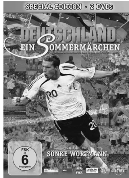
Abb. 2: DEUTSCHLAND. EIN SOMMERMÄRCHEN (2006)

Die insgesamt also doch positiven Signale für den Bereich der Kinoproduktionen sind in mehrerlei Hinsicht einzuschränken. Vor allem deswegen, weil ein Großteil des Publikums von einigen wenigen Filmen generiert wurde. Auch wenn es sich um einen breiten Trend handelt, von dem auch kleinere Produktionen profitieren, so verteilt sich der Löwenanteil des Millionenpublikums in der Regel auf drei bis vier