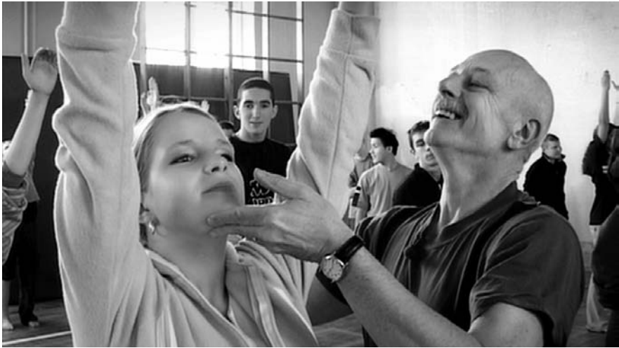
Abb. 1: RHYTHM IS IT! (2004)

Image» 9 , verschwunden sind. Der FAZ-Autor Andreas Kilb spricht davon, dass der derzeitige Erfolg des Genres von Filmen getragen sei, die das Ideal des klassischen Dokumentarfilms verfehlen. 10 An diesem Punkt ließe sich hinterfragen, was genau ein solches Ideal sein kann. Ein pädagogischer Impetus passt jedenfalls kaum mehr in die moderne Medienlandschaft und so besticht das nonfiktionale Erfolgskino mit Schauwerten und Geschichten, die der fiktionalen Konkurrenz kaum nachstehen.