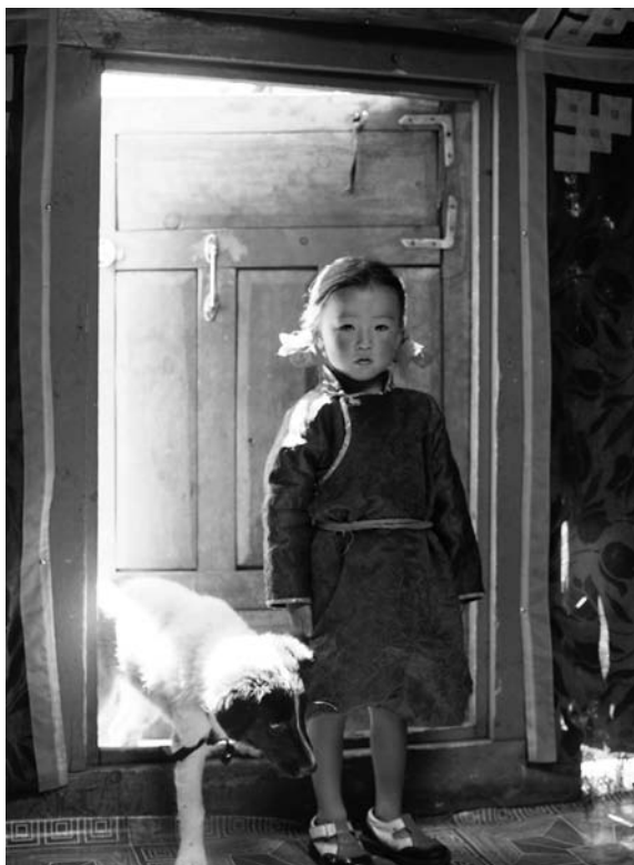
Abb. 3: DIE HÖHLE DES GELBEN HUNDES (2005)

Dass die Rezeptionsumstände des Kinos andere sind als die der Bildschirmmedien, muss an dieser Stelle nicht weiter erläutert werden. In welcher Weise die Anordnung der Kinoapparatur (dunkler und öffentlicher Kinosaal, eher passive Rezipientenhaltung etc.) darauf angelegt ist, die Sinne des Rezipienten zu überwältigen, ist in verschiedenen Theorien zum Kino-Dispositiv beschrieben. Das Wahrnehmungsdispositiv wirkt auf die kognitive