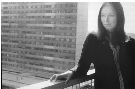
9 | Filmstill zu „2 ou 3 choses que je sais d'elle“, Regie: Jean-Luc Godard, Frankreich 1967

Im Bildteil der publizierten Kongressakten figurierten dann allerdings zu Argans Beitrag ausschließlich Filme, die dem Art Cinema zuzuordnen sind: Jean-Luc Godards Zou 3 choses que je sais d'elle und Une femme mariée , Michelangelo Antonionis L'eclisse und La notte sowie weitere Filme