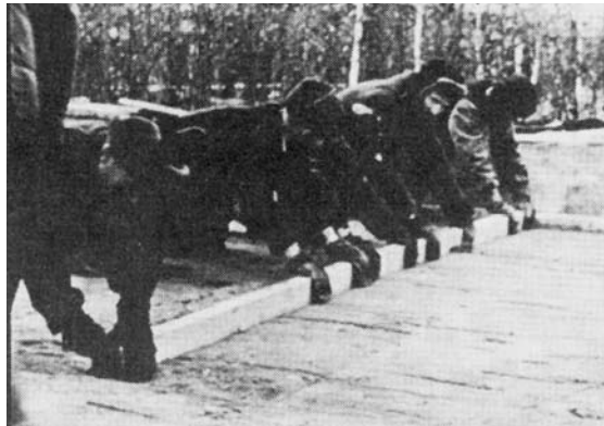
7, 8 | Fotogramme aus „Lettre de Sibirie, Regie: Chris Marker, Frankreich 1958

Lettre de Sibirie ist unter anderem ein Bericht über eine Stadt in Veränderung: Eine längere Passage ist Jakutsk gewidmet, der Hauptstadt der damaligen Jakutischen Autonomen Sozialistischen Sowjetrepublik. Die Aufnahmen für seinen „Brief“ machte Marker selber vor Ort, den Film stellte er nach seiner Rückkehr in Paris fertig. Darin führt er eine kurze Bildsequenz aus Jakutsk dreimal hintereinander vor, wobei jedes Mal ein anderer gesprochener Kommentar beifügt ist. Im ersten Durchlauf ist die Rede von einer modernen Stadt mit komfortablen Autobussen, Vorzeigekarossen der heimischen Autoindustrie und freudiger sozialistischer Aufbauarbeit für die Zukunft der Stadt. Im zweiten Durchlauf werden die Stadt als düster und der Autobus als vollgepfert bezeichnet, die Karosse als dem gemeinen Volk vorenthalten und die sozialistischen Straßenarbeiter als nahe der Sklaverei. Der dritte Kommentar – zu den noch einmal gleichen Bildern – bemüht sich um Ausgewogenheit, spricht von Aufbruchstimmung, aber auch von Schwierigkeiten.