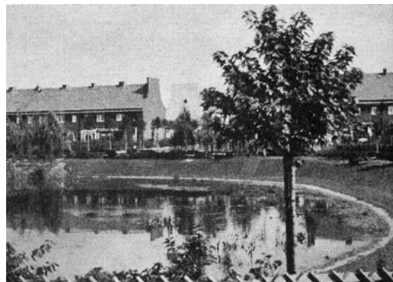
1–4 | Fotogramme aus „Die Stadt von morgen“, Regie: Svend Noldan, Deutschland 1930