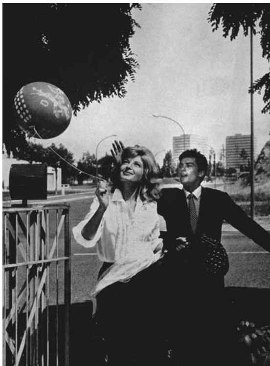
10 | Filmstill zu „L'eclisse“, Regie: Michelangelo Antonioni, Italien 1962

der neuen Wellen um 1960. Oder Le mani sulla città , in dem Francesco Rosi eine visuell beredte Anklage gegen Bauspekulation und fehlgeleitete Stadtplanung vorgelegt hatte. Argan scheint seinem eigenen Plädoyer für den „kleinen Film“ nicht wirklich getraut zu haben. Seine dezidierte Bezugnahme auf das alltagsbezogene, weitgehend vor Ort gedrehte Filmschaffen unterscheidet Argan jedoch in bemerkenswerter Weise von früheren Versuchen der Instrumentalisierung des Mediums. Und sie aktualisiert die Forderung eines H. W. Jost nach (auch) massentauglichen Filmen. Eine Auffassung, die bis heute bedeutend geblieben ist.