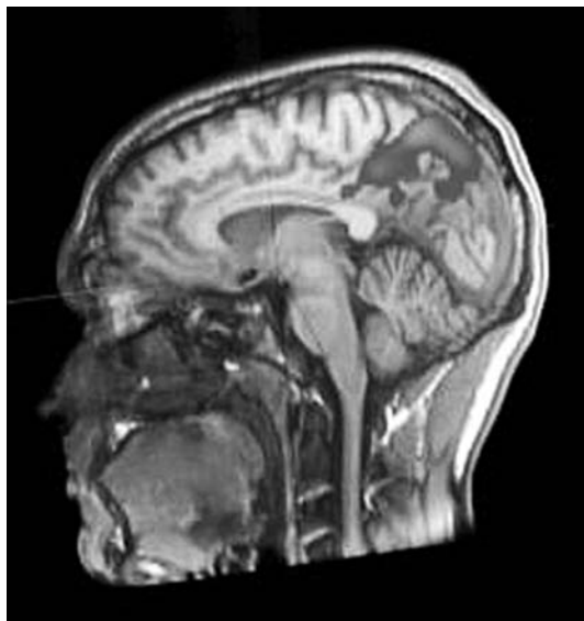
Abb. 3: fMRT-Hirnbild: Die grauen Flecken im oberen Hinterkopf sind in der farbigen Darstellung leuchtend rot

Durchmesser der Röhre im Magnetresonanztomografen, die ungewohnte Situation, Geräusche und Licht oder Dunkelheit können Beklemmungs- und Angstgefühle während der 10-30-minütigen fMRT-Aufnahme des Gehirns auslösen. Zudem können während der Messdatenerhebung beispielsweise durch Bewegung der Person oder auch Beeinträchtigungen durch Funkübertragungsgeräte Artefakte in der grafischen Umsetzung entstehen. Zu den «Desillusionierungen» der Hirnbilder steht nicht nur der Entstehungskontext derselben, sondern auch die Tatsache, dass das