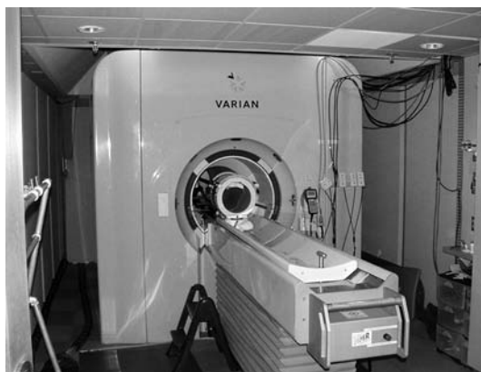
Abb. 1: Magnetresonanztomograf Varian 4T, fMRI an der University of California, Berkeley 2005

Bei den durch den fMRT erhobenen Datenmengen handelt es sich um große Datenvolumen. In einem Folgeschritt werden diese zur Erstellung von grafischen Ausgabeformen in der Bildgebung ausgewertet und analysiert. Wie auch bei anderen bildgebenden Verfahren geht die fMRT dabei mit starken Komplexitätsreduktionen einher. Dieser Reduktionismus wurde auch im Fach heftig diskutiert. Ein nach der Messung erfolgreiches rechnerisches Verfahren macht die grafischen Darstellungen zu kontrastreichen Bildern. Dargestellt werden diejenigen Hirnregionen, welche, verglichen mit einer Kontrollmessung, aktiv waren. Ohne diesen Zwischenschritt müssten die Bilder theoretisch farbensprühend sein, denn das Gehirn ist permanent aktiv. Darüber hinaus handelt es sich bei den sichtbaren Farbfeldern um so genannte Falschfarben, die ebenfalls nichts mit dem Gehirn zu tun haben. Es sind farbige Darstellungen statistischer Berechnungen des Computers, welcher mit zuvor festgelegten Schwellenwerten operiert. Darunter liegende Veränderungen werden nicht mehr farbig kodiert. Die farbigen Felder rühren also nicht von der Gehirnaktivität selbst, deren Begrenzungen generell nicht deutlich vollzogen werden kön-