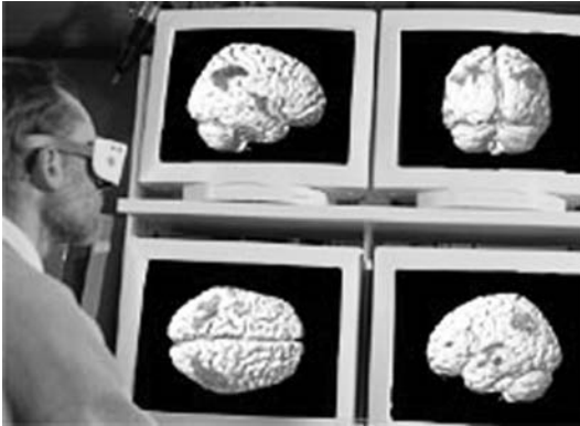
Abb. 4: Abbildung im Beitrag «Die Gehirn-Visionäre» mit der Bildunterschrift «Alzheimer erkennen: Auf Spurensuche im Gehirn-Bild»

Es ist hinlänglich bekannt, dass Resultate bildgebender Verfahren per se leicht ihre Entstehungshintergründe vergessen lassen. So rückt beispielsweise die Tatsache, dass sie statistische Folgerungen und keinesfalls Abbilder darstellen, trotz zumeist besseren Wissens, – also gewissermaßen im Hinterkopf – aus dem Blickfeld. 7