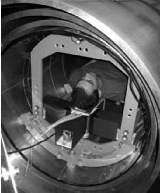
Abb. 2: Der Proband abgeschirmt in der Röhre des fMRT

nen. Sie sind den statistischen Berechnungen um einen von den jeweils forschenden Wissenschaftlern festgelegten Schwellenwert herum geschuldet. Dieser weitere Aspekt trägt zur Relativierung der zugeschriebenen Bildausage bei und es wird sowohl in der «scientific community» als auch im öffentlichen Diskurs problematisiert, dass die Visualisierung der Messdaten auf den kursierenden fachlichen Modellvorstellungen beruht. Damit basieren diese Grafiken auf einer konstruktiven Leistung.