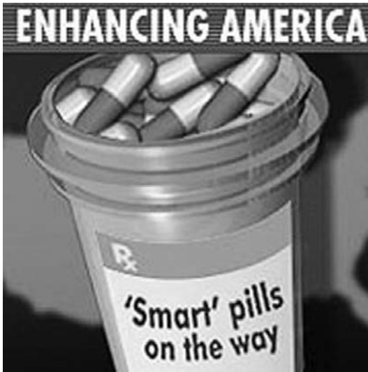
Abb. 6: Abbildung aus der Zeitschrift ›USA Today‹ vom 7. Juli 2004 in der Rubrik ›Lifestyle›

hergehenden Körperkult folgt nun also die Optimierung der Seele. Gehirndoping überholt Alkoholkonsum und Rausch. Insofern ist der Bereich des Neuro-Enhancement durchaus als Angebot zur Selbstdressur zu verstehen. Der Kulturhistoriker Hans Peter Dürr warnt vor einer derartigen Endlosschleife, denn hiermit werde die Individualisierung weiter vorangetrieben sowie soziale und gesellschaftliche Bezüge noch fragiler. Bereits Günther Anders fragte in seinem Buch Die Antiquiertheit des Menschen nach der «Seele im Zeitalter der zweiten industriellen Revolution». Könnte