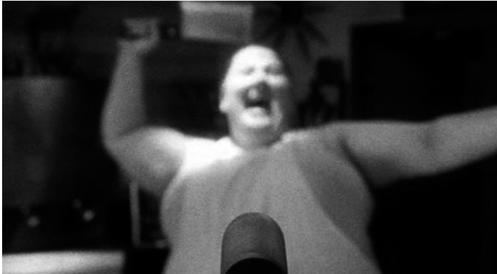
ABBILDUNG 4: NATURAL BORN KILLERS.