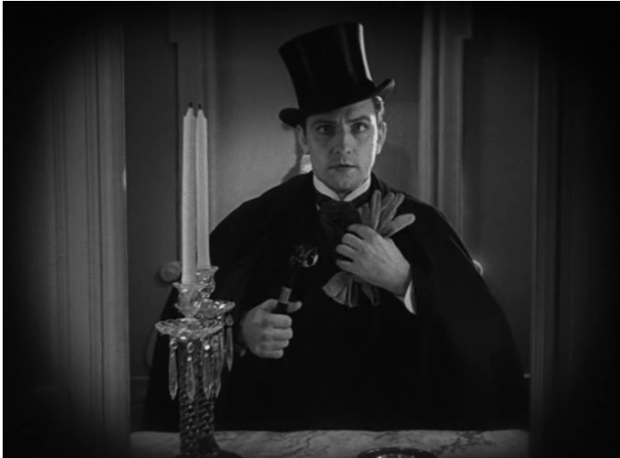
ABBILDUNG 1: DR. JEKYLL AND MR. HYDE.