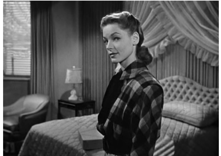
ABBILDUNG 2: DARK PASSAGE.