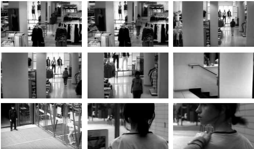
Abb. 15–23: GESPENSTER , TC 0:39:52–0:40:48

Nach ca. 40 Minuten führt der Film die Geschichten Ninas, Tonis und Françaises in dem Moment zusammen, als Françoise aus dem Fenster ihres Hotelzimmers beobachtet, wie die beiden Mädchen einen Platz überqueren. Mit «Je vais aller faire un petit tour. Je vais m'acheter des chaussures.» (TC 0:38:17 42 ) erfindet sie rasch eine Ausrede, um dem Hotelzimmer und ihrem Mann Pierre zu entkommen, um den Mädchen zu folgen. 43 Die Kamera schneidet auf die in einer Umkleidekabine sitzende Nina um, die darauf wartet, dass Toni ihr die Schere reicht, um die an der Ware befestigten Preis- und Sicherheitsetiketten entfernen zu können. Zunächst beobachtet die Filmkamera das Mädchen aus einer extremen Aufsicht, um dann – in Großaufnahme der Schere – den kriminellen Vorgang zu zeigen. Kurz darauf setzt der Film aus, und auf den Bildern einer Überwachungskamera sehen wir Toni, gefolgt von Nina, um die Ecke kommen (TC 0:39:52ff, Abb. 15–16). Wie schon in DIE INNERE SICHERHEIT sind die Bilder bläulich eingefärbt, doch während wir dort nur das Aufnahme- oder Abspielgeräusch des Rekorders vernehmen, ist den Überwachungsbildern aus GESPENSTER gleiche rhythmische Musik unterlegt