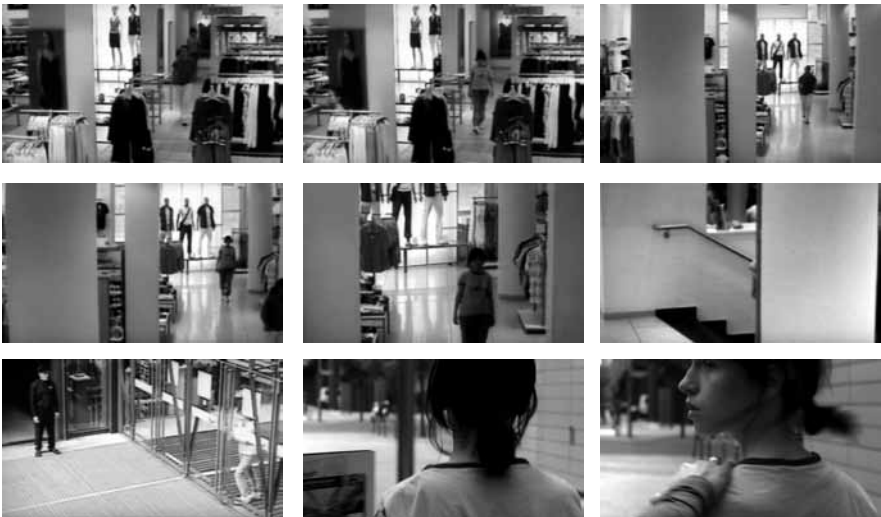
Abb. 15–23: GESPENSTER , TC 0:39:52–0:40:48

Nach ca. 40 Minuten führt der Film die Geschichten Ninas, Tonis und Françaises in dem Moment zusammen, als Françoise aus dem Fenster ihres Hotelzimmers beobachtet, wie die beiden Mädchen einen Platz überqueren. Mit «Je vais aller faire un petit tour. Je vais m'acheter des chaussures.» (TC 0:38:17 42 ) erfindet sie rasch eine Ausrede, um dem Hotelzimmer und ihrem Mann Pierre zu entkommen, um den Mädchen zu folgen. 43 Die Kamera schneidet auf die in einer Umkleidekabine sitzende Nina um, die darauf wartet, dass Toni ihr die Schere reicht, um die an der Ware befestigten Preis- und Sicherheitsetiketten entfernen zu können. Zunächst beobachtet die Filmkamera das Mädchen aus einer extremen Aufsicht, um dann – in Großaufnahme der Schere – den kriminellen Vorgang zu zeigen. Kurz darauf setzt der Film aus, und auf den Bildern einer Überwachungskamera sehen wir Toni, gefolgt von Nina, um die Ecke kommen (TC 0:39:52ff, Abb. 15–16). Wie schon in DIE INNERE SICHERHEIT sind die Bilder bläulich eingefärbt, doch während wir dort nur das Aufnahme- oder Abspielgeräusch des Rekorders vernehmen, ist den Überwachungsbildern aus GESPENSTER gleiche rhythmische Musik unterlegt