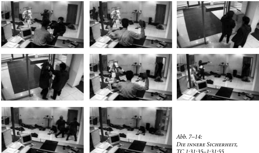
Abb. 7–14: DIE INNERE SICHERHEIT, TC 1:31:35–1:31:55

3. Auf der Basis der Beobachtungen Jeannes fertigen Klara und Hans eine Zeichnung der Bank an: «Und hier ist der Seitenausgang zum Parkplatz, ja? – Ja. – Und die war auf? – Hm.» (TC 1:25:20–1:25:30) Nur kurze Zeit später sitzt Jeanne im Auto. Den zufällig passierenden Heinrich wehrt sie heftig ab. Die Eltern kommen aus der Bank, fahren aber – entgegen des ursprünglichen Plans – in die Villa zurück, um Hans' Schusswunde versorgen zu können. Jeanne beteuert, dass der Seitenausgang geöffnet gewesen sei, als sie in der Bank war. Klara bleibt die Antwort schuldig, sagt lediglich, dass sie einen Mann erschossen habe. Die Geschichte scheint eindeutig, trotzdem wird der Überfall aus Sicht der Überwachungskamera wiederholt. (TC 1:31:35–1:31:55, Abb. 7–14) 31 Die in Einstellung und Perspektive übereinstimmenden, auffallend ruckartigen Bilder (Abb. 4–6 und Abb. 9–10) scheinen beider «Aussagen» zu bestätigen, gleichwohl dienen die sich durch mangelnde Tiefenschärfe auszeichnenden «Mikrodram[en] der Überwachung» 32 mit ihren «flache[n] Körper[n] in flachen Räumen» 33 in erster Linie der Identifikation. Während nun im ersten Beispiel die Überwachungsbilder die filmische Erzählzeit aus- und gleichzeitig ersetzen, heben die Bilder des zweiten Beispiels die formale Linearität der Erzählung und ihrer Zeit auf. In der Interaktion verschiedener medialer Bild- und Zeitlichkeiten setzen die Filme die Zeit der Handlung aus, um eine eigene Temporalität zu entwickeln.