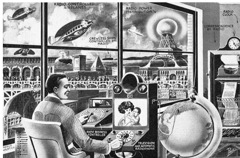
Abb. 4 Hugo Gernsback: The Future of Radio

Douglas kontextualisiert diese Ideale auch mit anderen Entwicklungen dieser Zeit, wie der neuen Bedeutung, die man seinerzeit generell dem Erwerb von Bildung und Spezialwissen beimaß, und beschreibt diese technische euphorische Vision der ‘rags-to-riches-stories’ folgendermaßen: „Everything could be achieved through technical mastery.“ (Douglas 1987: 190-192)