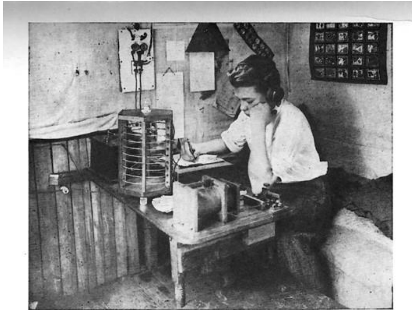
An amateur "wireless man" at work