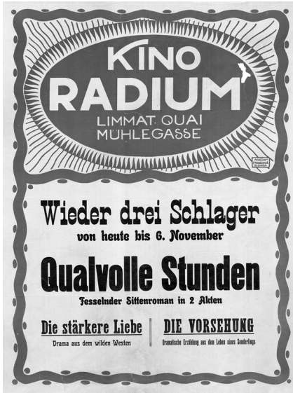
Abb. 4 Plakat des Kinos Radium (Zürich) für LA FOSSA DEL VIVO (I 1912, Itala, mit Lydia Quaranta), THE GREATER LOVE (USA 1912, Vitagraph, Rollin S. Sturgeon) und THE WILL OF PROVIDENCE (USA 1911, Solax) [?] vom 31. Oktober 1912; Druck: Atelier Metropoli, Zürich; Zweifarbandruck, 76 x 100 cm; restauriert

relativ einfache, zweifarbige Textplakate im Format 76 x 100 cm aus lokaler Produktion. Weil der farbige Rahmen mit auffälligem Radium-Logo (rot oder grün) auf Vorrat gedruckt werden konnte und bei Bedarf nur noch die schwarze Schrift nachgedruckt werden musste, waren die Plakate in der Herstellung günstig.