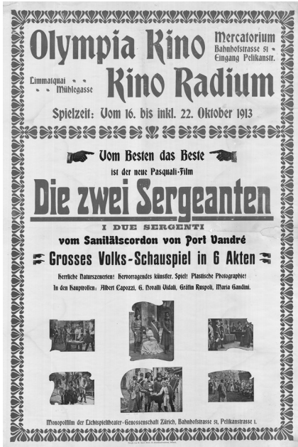
Abb. 5 Plakat der Kinos Olympia und Radium (Zürich) für I DUE SERGENTI (I 1913, Pasquali, Ubaldo Maria Del Colle) vom 16. Oktober 1913; Druck: K. Graf, Bülach; Zweifarbendruck, 64 x 94 cm; restauriert

Auch visuell machen viele Filmplakate einen übersteigerten und überladenen Eindruck. Ähnlich wie die übrige Produktwerbung setzte die Kinoreklame mit der Nennung von Produktionsfirma, von Genres, von Schauspielern und später auch von