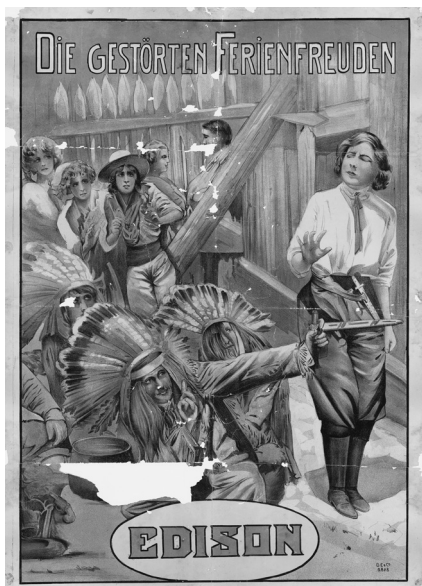
Abb. 6 Plakat für THE MODERN DIANAS (USA 1911, Edison); Druck: Dinse, Eckert & Co., Berlin; mehrfarbige Lithografie, 71 x 100 cm; restauriert

Regisseuren und im lokalen Kontext mit dem Hinweis auf einzelne Kinos gelegentlich auf bewährte Werte und nutzte diese wie eine Produktmarke. 28