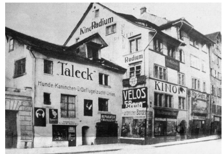
Abb. 2 Fotografie des Kinos Radium (Zürich) von circa 1915 mit Plakaten für den Film L'EMDORMEUSE (F 1914, SCAGL)