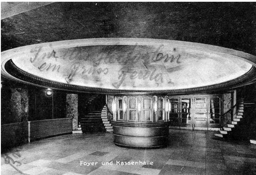
Foyer und Kassenhalle