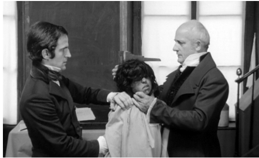
Abb. 1 Der Knabe als Untersuchungsobjekt zwischen Itard und Pinel

Die Quellengrundlage für das Drehbuch von François Truffaut und Jean Gruault bildete Jean Itards Schrift Mémoire et rapport sur Victor de l'Aveyron aus dem Jahr 1806. 39 Beide Autoren folgen Itards Bericht hinsichtlich