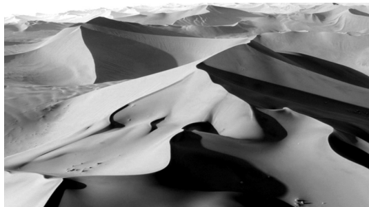
3–4 Unbelebte Landschaften am Anfang von EARTH

um kurz beim Ausklingen des Wortes Erde in stärkster Belichtung zu verharren, parallel hebt sich dazu auch die Musik. Dem folgt sodann eine Erzählkette, die die Bedingungen des Lebens kosmisch herleitet. Auffällig ist, dass der Kommentar einzig durch unbelebte und gleichsam unbewegte Landschaften bebildert wird (Abb. 3–4). Die genannten idealen Bedingungen für Leben erscheinen anschließend als unkommentierte Bilder bewegten Wassers und einer sich wiederum bewegenden Sonne. Erst nachdem Licht und flüssiges Wasser so visuell eingeführt sind geraten Vögelschwärme ins Bild, zeigt sich das Leben in Bewegung, wobei in hoher Schnittfrequenz auf Bilder des Films – unterbrochen von den Bildern des Planeten wie zu Beginn nur diesmal mit untergehender Sonne – vorverwiesen wird. Das letzte Bild zeigt einen Blitzeinschlag, dem die verschiedenen episodischen Filmhandlungen folgen, die das narrative Gefüge des filmischen Textes fortan prägen, wobei die Narration bzw. Enunziation auf syntagmatischer Ebene nicht im Sinne einer handlungsprogressiven Erzählung als linear narrative Syntagmen, sondern als Syntagma der zusammenfassenden Klammerung, in das sich gleichwohl narrative Syntagmen auf untergeordneter Ebene einfügen und den Filmtext in vielfacher Weise fälteln. 15 Neben der sich steigernden Sichtbarkeit des Planeten am Anfang