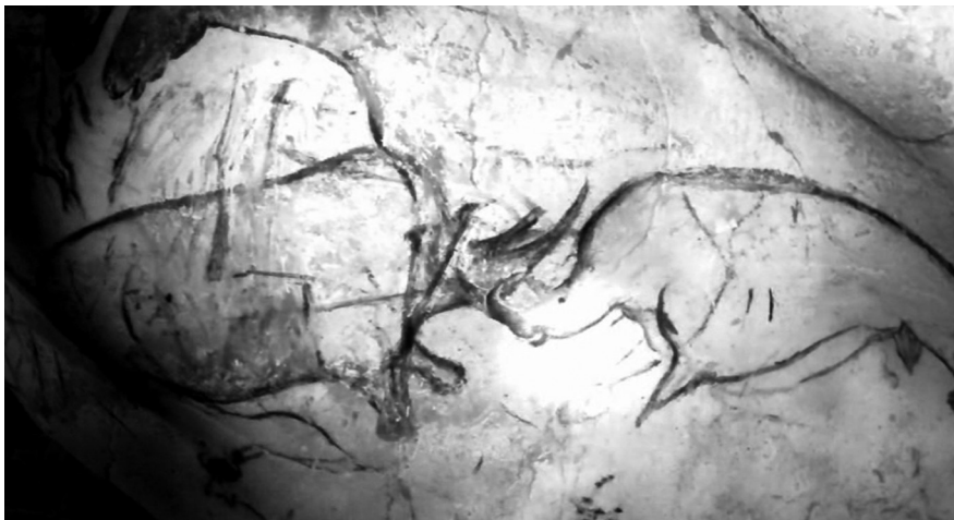
2 Das Urkino der Chauvet-Höhle

kenswert, denn die Tiere in den gefilmten Höhlenbildern sind ebenso der Vergangenheit angehörig wie die Tiere in EARTH. Lediglich die zeitlich Distanz lässt die ›Träume‹ also die phantasmatische Ausstrahlung der Bilder in der Höhle vergessen, wohingegen die phantasmatische Ausstrahlung der Tiere in EARTH ihre Vergangenheit jetzt vergessen lässt und in die Zukunft projiziert und in EARTH zunächst als Überzeitlichkeit der Erzählung zum Ausdruck kommt und den Blick zunächst auf die filmische Raumkonstruktion lenkt. Die Exposition des Films lässt sich dabei durchaus als geologische Overtüre und gleichsam als Derivat einer Genesis-Erzählung bezeichnen, die zu Beginn in die kosmische Dimension überführt wird. Die einleitende Erklärung aus dem Off und angesichts des Bildes aus dem ›outer space‹ führt diese Dimension vor Augen und Ohren des Zuschauers: