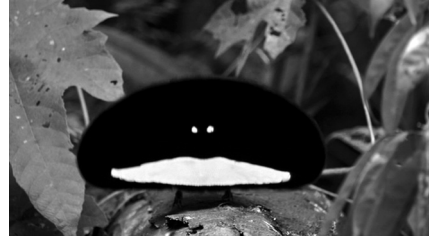
8–9 Balzende Paradiesvögel

rückt und hierin eine symbolische Ordnung hervorruft, in der der Mensch als filmfähiges Wesen sich raumzeitlich über das Tier erhebt.