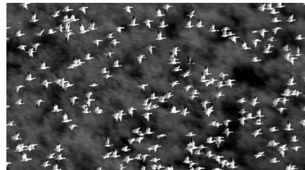
5–7 Auflösung des Tieres in der Masse in EARTH

Die tragenden Strukturen dieses Weltbildes sind dabei zum einen die Einmaligkeit und zum anderen die unwahrscheinliche Zufälligkeit des Lebens auf der Erde, die mit dem Blitz einschlag am Ende der Anfangssequenz auf einen beinahe göttlichen Fingerzeig hin fort gedeutet werden können. Das ästhetische Programm ist dabei auf Überwältigung angelegt, was auch durch den, den visuellen Eindruck verstärkenden, Einsatz der Musik zum Ausdruck kommt und insbesondere in zwei den Film durchziehenden ästhetischen Ausformungen zu beobachten ist und deren Wahrnehmung durch eine Erhabenheitskonstruktion zum Ausdruck kommt. Zunächst in den häufig auftretenden Massenszenen, in denen Herden und Schwärme den Blick auf das einzelne Tier auflösen und eine Wahrnehmungsüberforderung des Zuschauers münden, der sich dieser mit kalkuliertem Staunen aussetzen kann. Das Filmtier löst sich in einer polymorphen Masse auf, die im Extremfall in ein reines visuelles Rauschen überführt wird, wie etwa an der Aufnahme eines Schwarms Blutschnabelweber ersichtlich wird, wobei nur eine Prüfung des Bildes in der Fernsehserie mit dem dort verwendeten Kommentar darüber Auskunft gibt, dass es sich um Blutschnabelweber ( Quelea quelea , eine Art afrikanischer Sperlingsvögel) handelt. In der Kinoanordnung des Bildes ist die