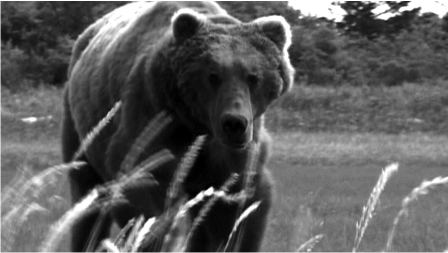
1 Das «majestätische Tier» in Werner Herzogs GRIZZLY MAN

Suche nach einer tiefen ertümlichen Begegnung, aber er überschritt dabei eine unsichtbare Grenze. 10