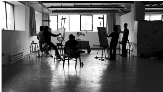
2–3 Betrachtungsanordnungen und Blickbeziehungen: Tierzeichner in BESTIAIRE

dem die Aufmerksamkeit der zeichnenden Darstellerin gilt: eine Rehantilope ( Pelea capreolus ). Unwillkürlich suchen wir den Blick des Tieres, doch seine seltsam ins Leere starrenden Augen entziehen sich uns ebenso wie zuvor jene der Zeichnerin.