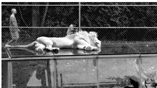
4–5 Schaustellungen des Zoo-Film-Tieres: Tierpräparate und ‹Löwentunnel› in BESTIAIRE

er durch jene schauenden Darsteller auf der Leinwand nutzt Côté geschickt als Verweis auf diverse Formen der menschengemachten und sich an Menschen richtenden Schaustellung von Tieren. Beginnend bei den Zeichnern der Eröffnungssequenz, kehrt dieses Motiv beständig wieder. So wird beispielsweise eine offenbar verletzte Hyäne zur Untersuchung in ein wie ein mittelalterliches Folterinstrument anmutendes Konstrukt aus Schiebegittern gesperrt, um sich dem Blick der sie untersuchenden und behandelnden Pfleger (aber auch der Zuschauer) nicht entziehen zu können. Ähnlich verhält es sich in einer langen Szene in der Werkstatt zweier