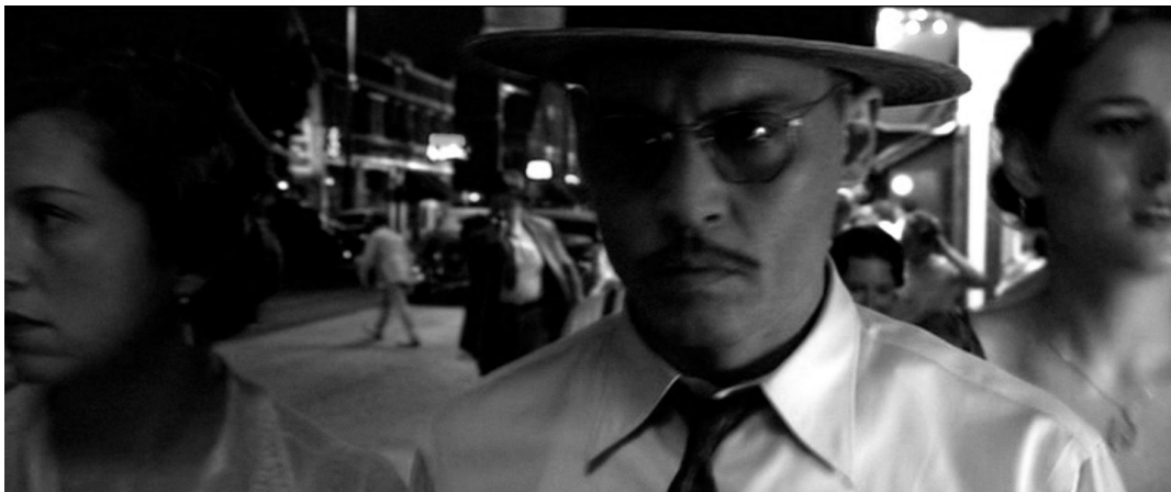
Abb. 6: Gegenwart der Geschichte in »Public Enemies«

Einerseits sind die USA der 1930er Jahre geradezu hyperrealistisch rekonstruiert, Kulissen, Kostüme und Requisiten imitieren Zeitdokumente in einer Akribie, die nur sich vergleichen lässt mit dem obsessivsten Authentizitätspathos im Kino, mit Erich von Stroheims Foolish Wives (USA 1922), Cecil B. DeMilles Union Pacific (USA 1939), Luchino Viscontis Il Gattopardo (Italien/Frankreich 1963) oder Michael Ciminos Heaven's Gate (USA 1980). Doch der dort postulierte Geltungsanspruch ist bei Mann andererseits zur Gänze verflogen, die Ausstattungsarbeit geht nicht mehr auf in illusionistischer Funktion. Die HD-Bilder signifizieren stattdessen eine Gegenwart der Geschichte, nicht nur als Raum des Möglichen, sondern als Raum des Materiellen.