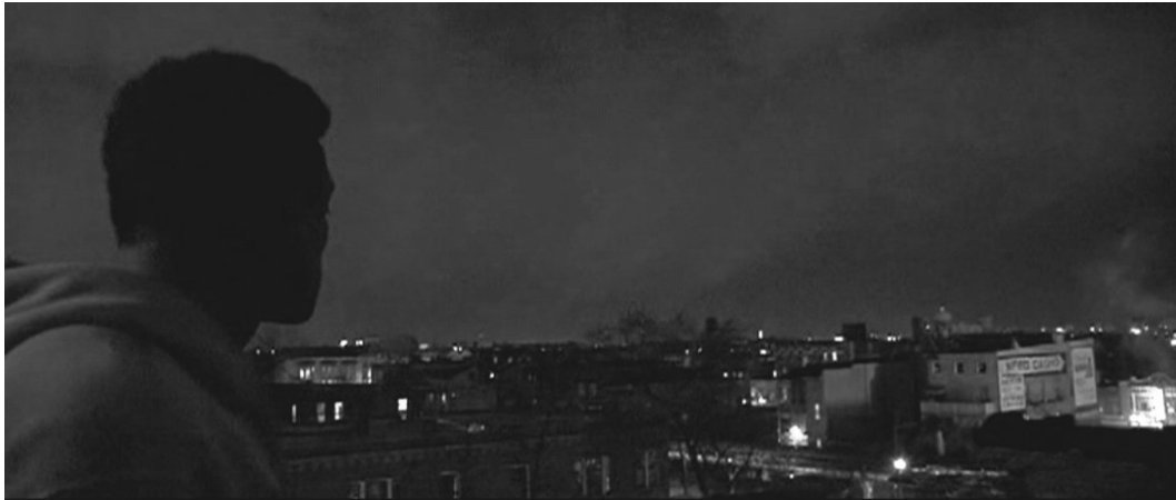
Abb. 2: HD-Aufnahmen des Protagonisten in »Ali«