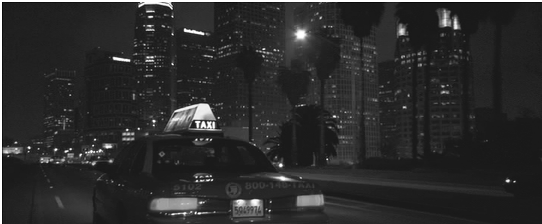
Abb. 3: Licht- und Schatteninszenierung in »Collateral«