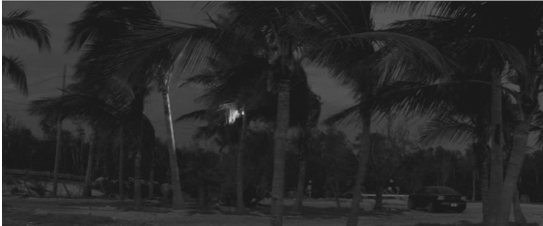
Abb. 4: Atopische Signifikanten in »Miami Vice«

ist«. 26 Punctum, das meint für Barthes: »Stich, kleines Loch, kleiner Fleck, kleiner Schnitt – und: Wurf der Würfel«. Es ist in der Fotografie jenes Aleatorische, das sofort auffällt und den Blick dabei attackieren will, das also auch »verwundet, trifft« 27 . Ob wehende Palmen im Wind, ob sprudelnde Wasserfälle, ob wolkenbesetzte Nachthimmel, Manns Miami Vice ist bestimmt von solchen atopischen Signifikanten, blinden Flecken in völliger Transparenz, einem Mehr an Bedeutungspraxis, das in seinem Exzess nicht mehr bedeutet.