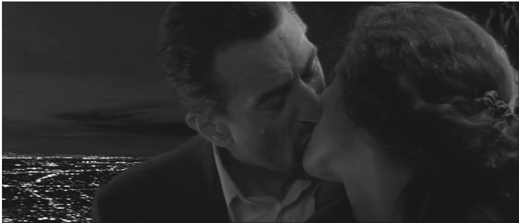
Abb. 1: Tiefenschärfe durch digitales Compositing in »Heat«

Schon bevor Michael Manns Filme von High Definition Video bestimmt sind, zeigt sich in seinem Kino eine Vorliebe für Konstruktionen piktorialer Evidenz als unmittelbare Materialität im Sinne Jean-Luc Nancys, 4 die seine spätere Arbeit mit HD bereits präfigurieren. In Heat (USA 1995) evozieren Mann und sein Kameramann Dante Spinotti damit onirische Effekte. Sie operieren hier noch mit analoger Fotografie, verarbeiten diese in der Postproduktion jedoch digital. Die Sequenz, in der sich Neil McCauley (Robert De Niro) und Eady (Amy Brenneman) über den Dächern von Los Angeles unterhalten und dabei den Blick auf das Lichtermeer der Stadt richten, ist vor Greenscreen aufgenommen, dann per Compositing aber mit fotografischen Aufnahmen der Skyline des nächtlichen Los Angeles kombiniert worden. Auf diese Weise bleiben die Figuren in ihrer unmittelbaren Umgebung ebenso in detail zu erkennen wie der wolkenverhangene Himmel, und zugleich wirkt das urbane Environment in ganzer Schärfe repräsentiert.