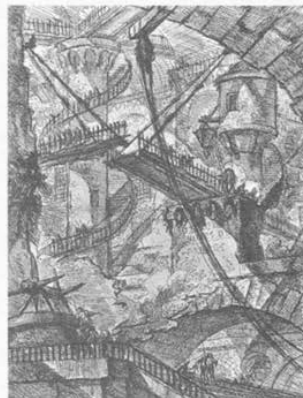
Piranesi's Carceri d'Invenzione , plate VII, Second Edition

Abb. 1: »Quick Topic Summary for Designers«, in: Meigs, Tom: Ultimate Game Design. Building Game Worlds , Emeryville, CA 2003, S. 313.