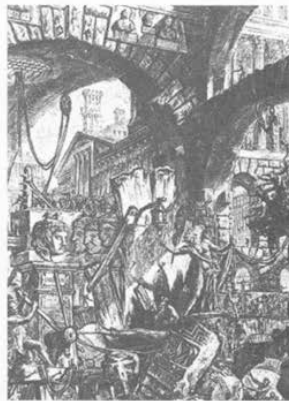
Piranesi's Carceri d'Invenzione , plate from Second Edition