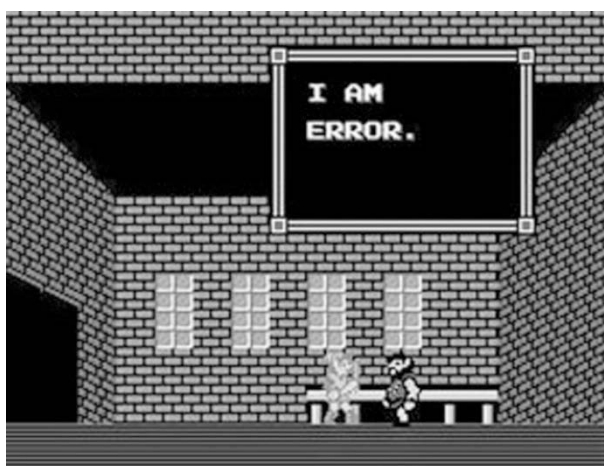
Abb. 1: »Zelda II: The Adventures of Link« (1987)

In einer bestimmten Hütte jedoch stößt der Spieler in Zelda II auf einen NPC, der weder etwas für die Handlung Nützliches zu sagen hat, noch interessante Hintergrundinformationen liefert. Dieser NPC steht einfach nur in seinem Haus und nennt seinen Namen (?), sobald er vom Spieler »angesprochen« wird: »I am Error«.