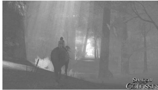
Abb. 4: Shadow of the Colossus (2005)

Dabei reicht das Spektrum vom Ideal der völligen Abwesenheit einer grafischen Benutzeroberfläche bis zur völligen Verdeckung des eigentlichen Bildgeschehens durch Interface-Elemente. In Spielen wie ICO oder Shadow of the Colossus werden nur die absolut nötigen Übersichtselemente angezeigt und auch nur wenn es die Spielsituation unbedingt erfordert. Reitet der Protagonist von Shadow of the Colossus zum Beispiel nur durch die Landschaft, sind außer dieser und den Avataren keinerlei Interface-Elemente zu sehen. Erst wenn es zu einem Kampf mit den titanischen Kreaturen des Spiels kommt, werden spartanisch gestaltete Interfacebestandteile wie ein Lebensbalken sowie eine Waffenanzeige eingeblendet. Diese verschwinden sofort wieder, sobald die Gefahr vorbei ist. Selbst das Abspeichern eines Spielstandes wird innerhalb der diegetischen Spielwelt verortet. In ICO etwa wird das Save-Menü in dem Moment aufgerufen in dem die beiden Protagonisten sich auf virtuellen Sofas niederlassen, die wie Fremdkörper in der archaischen Landschaft herumstehen, wohingegen in Shadow of the Colossus