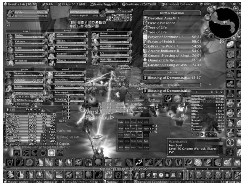
Abb. 5: World of Warcraft (2004)

Blizzards World of Warcraft hingegen ist ein Online-Rollenspiel, in dem bis zu 25 reale Spieler über eine Server/Client-Verbindung zusammen spielen können. Hier ist das sogenannte »Endgame« eine hochkompetitive Angelegenheit. Die höchststufigen Spielinhalte, die sogenannten »Raids«, sind nur mit guter Gruppenkoordination und optimaler Informationskontrolle seitens der Spieler zu bewältigen. Um dies zu gewährleisten, können sich diese diverse Statistiken und Messdaten einblenden lassen, die zu jeder Zeit genauestens über das momentane Spielgeschehen Aufschluss geben. Je komplexer und schwieriger der Spielinhalt ist, desto mehr tritt das eigentliche Spielgeschehen, d.h. die Kämpfe innerhalb der diegetischen Spielwelt, in den Hintergrund. Übrig bleibt ein für den Laien unentzifferbares Gewirr von Anzeigen, blinkenden Flächen und statistischen Zahlenkolonnen. Das Interface überwuchert hier den Bildraum und lässt vom eigentlichen Spielgeschehen nichts mehr erkennen.