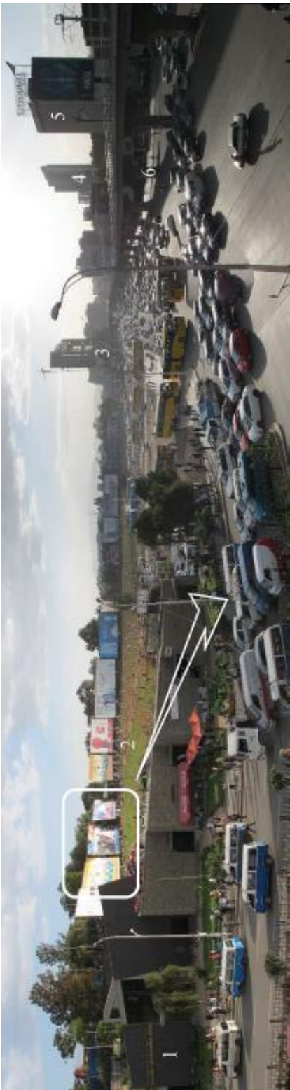
Abb. 2 (oben): Meskel Square Panoramaaufnahme (2015), Quelle: Autor Abb. 3 (rechts unten): Detailaufnahme Plakate mit politischem Inhalt (2015), Quelle: Autor Abb. 4 (links unten): Parteiplakat EPRDF (2015), Quelle: Autor