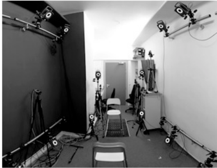
Abbildung 2: Technische Ausstattung im natural media lab in Aachen 26

Ein solches Labor ist im extremen Maße technisch ausgestattet, mit dem Ziel, Gesten in ihrer gesamten Komplexität zu erfassen. Hier wird mit über zehn 3D HD Kameras und einem ausgebauten Soundsystem gearbeitet.