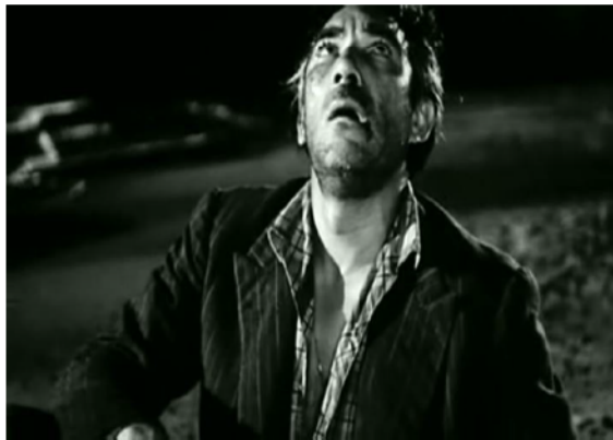
Abb. 4: Federico Fellini: La strada

Erfährt Mamma Roma am Ende des gleichnamigen Films beim Blick aus dem Fenster die Anwesenheit Gottes oder gerade dessen Abwesenheit (vgl. Abb. 5)? Die vorausgegangene piktorale Stilisierung ihres Sohnes Ettore zur Christusikone