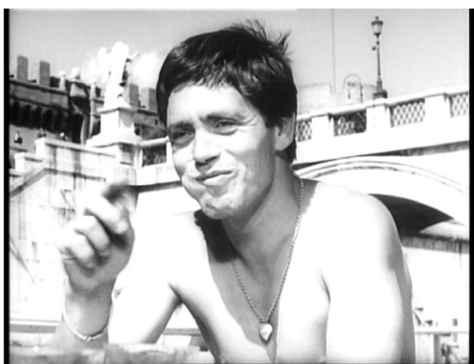
Abb. 1: Pier Paolo Pasolini: Accattone

Doch kommen wir nun zum dritten Verfahren der Überhöhung der Figur des Accattone durch den Rekurs auf pikturale Inszenierungsstrategien der christlichen Ikonografie. Der Film beginnt mit einem Streitgespräch zwischen Accattone und seinen Freunden, das im Abschluss einer Wette gipfelt: Schafft es Accattone mit vollem Magen von der Engelsbrücke zu springen, ohne zu verrecken? Accattone geht die Wette ein, spielt lustvoll mit der Grenze von Leben und Tod. Bevor wir den Sprung Accattones erleben dürfen, inszeniert Pasolini ein opulentes Gelage am Ufer des Tiber. Wir sehen Accattones Gesicht in Großaufnahme, schmatzend, kreatürlich, große Mengen von Nahrung aufnehmend, gerahmt durch die Brückenpfeiler der Engelsbrücke (vgl. Abb. 1).