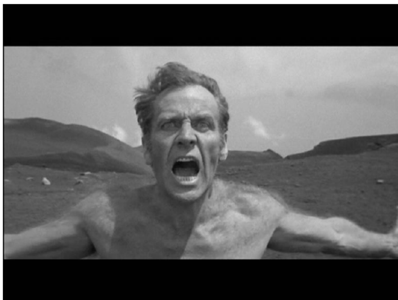
Abb. 7: Pier Paolo Pasolini: Teorema

sieht. Dies liegt außerhalb der Leinwand, in jenem so genannten champ aveugle , wie Pascal Bonitzer es benannt hat. Wir können dieses blinde Feld mit unserer eigenen Imagination füllen und somit in einem unabschließbaren Prozess Erlösungsfiktionen konstruieren und dekonstruieren.