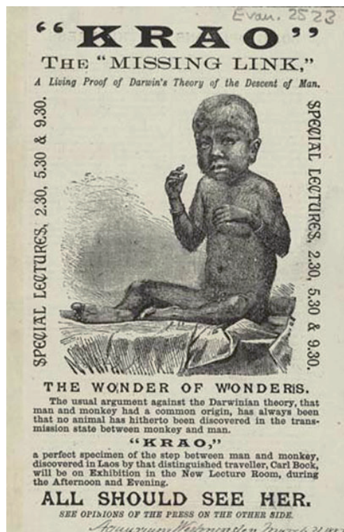
Abb. 4: La Nature, Mai 1883 ( http://www.bl.uk/learning/images/bodies/printlarge4801.html , Zugriff 17. 11. 08)