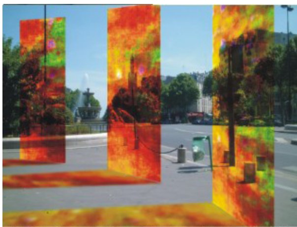
Abb. 6: Eggs & Bitschin: Endogramm Glasstelen, 20 mm x 100 mm x 3000 mm, Laminatglas mit integriertem Diafilm, Fixation, Place Félix Eboué, Paris, Frankreich, Projekt 2005

Eine andere Art des In-die-Tiefe-Gehens in ein Bild, an einem bestimmten, interessanten Punkt, zeigt Michelangelo Antonionis Film Blow Up (1966). Ein Fotograf macht in einem Park Fotos von einem Liebespaar. Als die Frau ihn entdeckt, verlangt sie die Herausgabe des Films. Der Fotograf händigt ihr jedoch einen falschen Film aus. Er entwickelt den richtigen Film und entdeckt auf den Vergrößerungen das verschwommene Gesicht eines Mannes, einen Revolver und einen Körper, der unter einem Baum liegt. Der Fotograf glaubt, einen Mordanschlag entdeckt zu haben, doch als er an den Tatort zurückkehrt, ist die Leiche verschwunden. Antonioni fragt hier nach der Realität von Bildern. Was geben Bilder wieder, sind sie realer als die Welt? Wie verlässlich sind ihre Deutungen? Als eine Freundin des Fotografen die vergrößerte Aufnahme mit der Leiche sieht, sagt sie: »Das sieht aus, als hätte es mein Freund gemalt«. Bei Antonioni sind Bilder Annäherungsversuche an die Wirklichkeit. Eggs & Bitschin dagegen entfernen sich von ihr durch den Zoom. Die Vergrößerungen lassen den Fotografen etwas klarer erkennen, etwas Bestimmtes: eine Leiche. Bei Eggs & Bitschin dienen die Vergrößerungen dazu, etwas Konkretes verschwimmen zu lassen. Die Frau