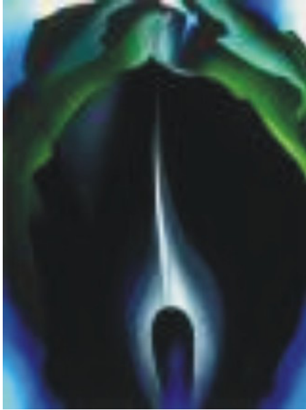
Abb. 7: Georgia O' Keeffe: Jack-in-the-Pulpit No. IV , 1930

in Pin – up, pose 10 verschwimmt in ein Zusammenspiel von Formen und Farben, das sich nicht mehr konkret zuordnen lässt.