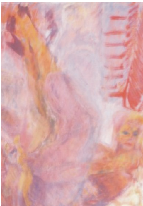
Abb. 1: Francine Eggs: Pin – up, pose 10 , 1982-84

Eggs & Bitschin leben in der Schweiz und arbeiten seit 1992 zusammen. Sie berufen sich in ihrer Arbeit auf Nietzsche, der bereits im 19. Jahrhundert eine Beschleunigung des Lesens erkannt hat. Der moderne Mensch liest, Nietzsche zufolge, einen Satz nicht mehr im Detail, er überfliegt ihn. Der Sinn des Satzes wird durch wenige Wörter zufällig zusammengesetzt, wodurch der Inhalt verfälscht werden kann. Nietzsche ruft zum Müßiggang auf, »weil Zeit zum Denken und Ruhe im Denken fehlt«. Auf die Bilder von Eggs & Bitschin übertragen, könnte es heißen: Zeit zum Sehen und die Ruhe stehen zu bleiben, um in die Tiefe vorzudringen. Eggs & Bitschin wenden sich mit ihrer Kunst gegen den von Nietzsche kritisierten ›hastigen Genuss‹, gegen die Bilderflut, gegen eine Beschleunigung des Betrachtens von Kunst.