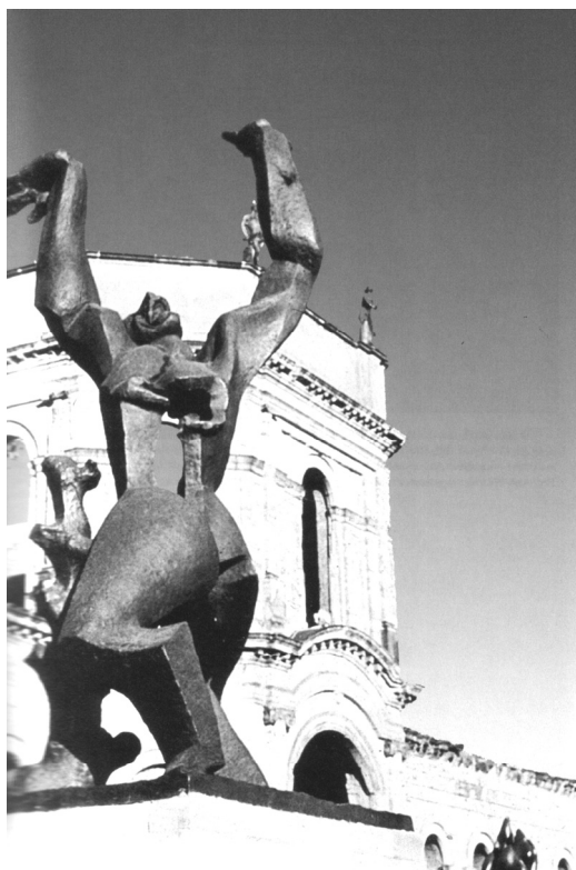
Abb. 3: Ossip Zadkine: Denkmal für das zerstörte Rotterdam, documenta 2 (1959).

Das museale Modell des provisorischen Fridericianums lässt sich infolge der angerissenen Bedeutungsregie durch Arnold Bode als ein mehrfach aufgeladener Ausstellungsort lesen, der topografisch, inszenatorisch und inhaltlich auf historisch bekannte Muster und Vorbilder rekurriert und daraus sein innovatives Potenzial für die Gegenwart auf der einen Seite und für eine (existentialistisch begründbare) Präsentationsästhetik auf der anderen Seite bezieht. 15 (Vgl. Abb. 3)