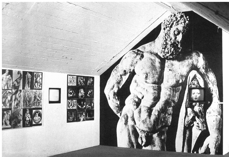
Abb. 5: Ulrike Rosenbach: Herakles – Herkules – King-Kong . Installation Museum Fridericianum, documenta 5 (1972).

thoden und letztlich auch die Interaktion zwischen Film und Betrachter zu fördern.