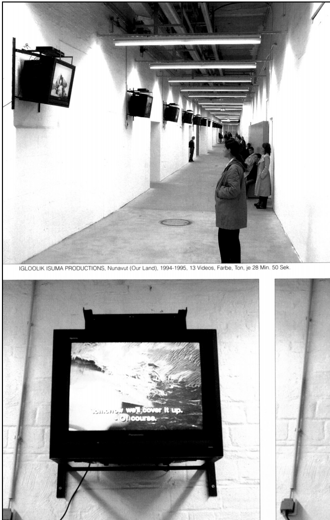
IGLOOLIK ISUMA PRODUCTIONS, Nunavut (Our Land), 1994-1995, 13 Videos, Farbe, Ton, je 28 Min. 50 Sek.