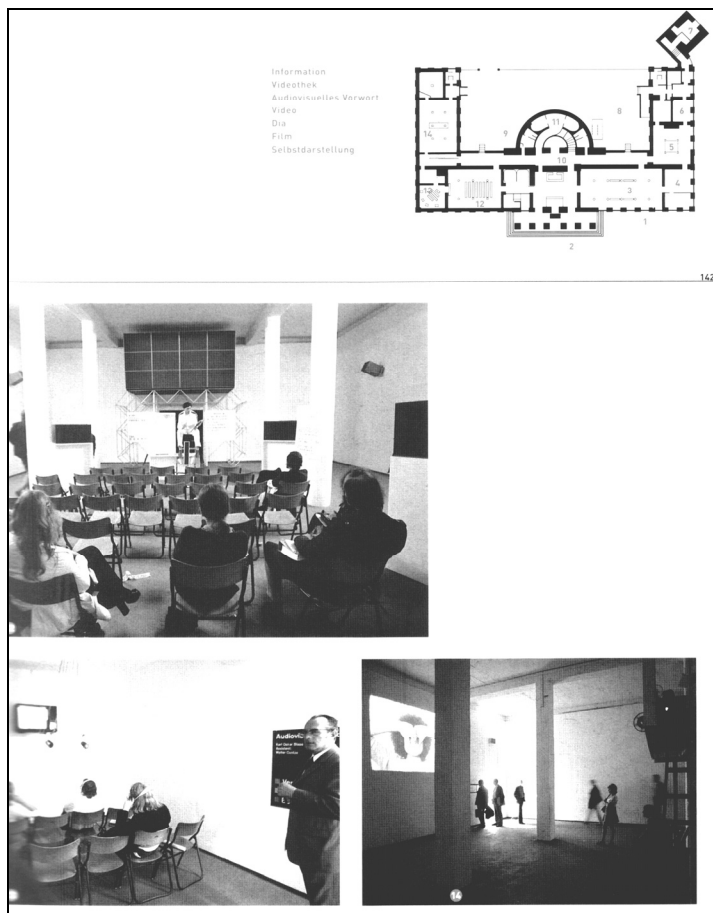
Abb. 4: Plan der documenta 5, aus: documenta 5: Befragung der Realität , Kassel 30. Juni bis 8. Oktober 1972.

Acconci, Joseph Beuys, Rebecca Horn und Bruce Nauman in einem eigenen ‚Filmraum‘ präsentierte (vgl. Abb. 4 zum Realisationsbereich Film).