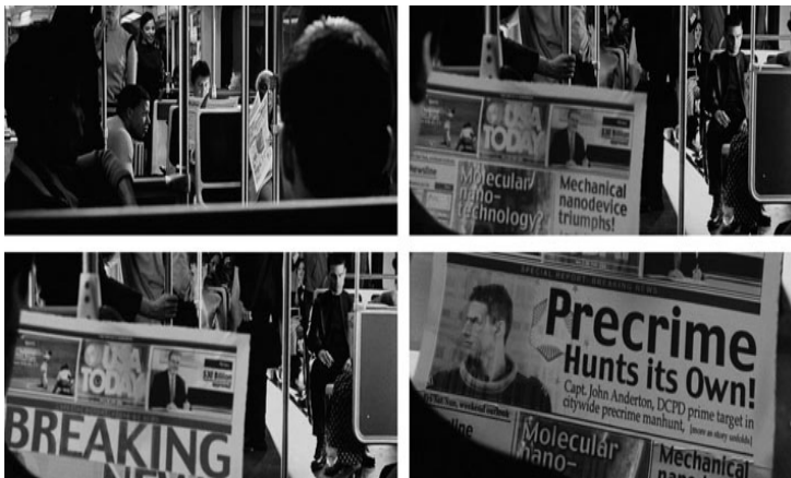
Abb. 2: Bilder aus MINORITY REPORT . In einblättrigen elektronischen Zeitungen können dringende Nachrichten kurzfristig und mobil angezeigt werden.