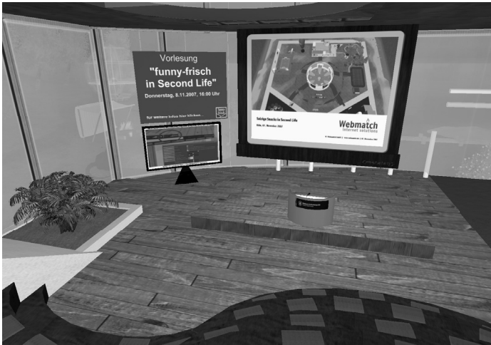
Abb. 3: Virtueller Hörsaal der Rheinischen Fachhochschule Köln in Second Life 17 .