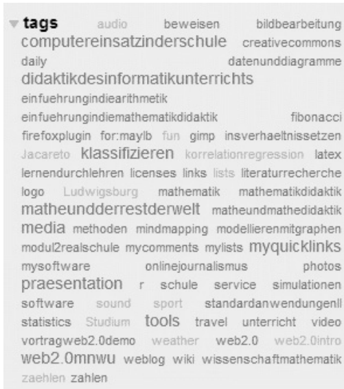
Abb. 2: Beispiel einer tag cloud 46 .

Abgelegte Lesezeichen sind auch für andere Personen zugänglich. So kann man sich z.B. Links anzeigen lassen, die von allen Nutzern des social bookmarking -Dienstes mit einem speziellen Tag abgelegt worden sind. Somit bieten social bookmarking -Dienste eine kollaborativ erstellte Linksammlung. Das gemeinschaftlich erstellte Kategoriensystem, das aus den Tags aller Benutzer gebildet wird, nennt man folksonomy . Im Gegensatz zu formal, im Vorfeld der Nutzung durch Experten definierten Taxonomien entstehen folksonomies durch die aktive Nutzung der Interessierten, sind damit automatisch valide und spiegeln den echten Gebrauch und Nutzen beim Suchen wider.