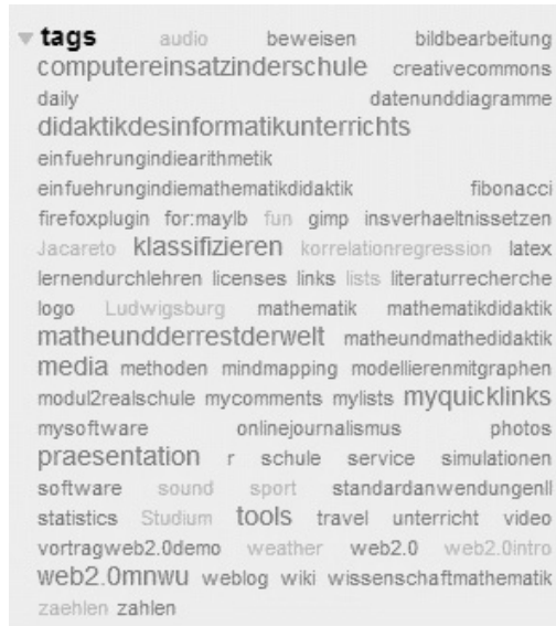
Abb. 2: Beispiel einer tag cloud 46 .

Abgelegte Lesezeichen sind auch für andere Personen zugänglich. So kann man sich z.B. Links anzeigen lassen, die von allen Nutzern des social bookmarking -Dienstes mit einem speziellen Tag abgelegt worden sind. Somit bieten social bookmarking -Dienste eine kollaborativ erstellte Linksammlung. Das gemeinschaftlich erstellte Kategoriensystem, das aus den Tags aller Benutzer gebildet wird, nennt man folksonomy . Im Gegensatz zu formal, im Vorfeld der Nutzung durch Experten definierten Taxonomien entstehen folksonomies durch die aktive Nutzung der Interessierten, sind damit automatisch valide und spiegeln den echten Gebrauch und Nutzen beim Suchen wider.