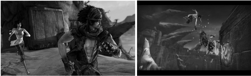
Abb. 1: Der Prinz und Erika, Prince of Persia

Die Figur der Erika ermöglicht in Prince of Persia so nicht nur das Speichern u.ä. diegetisch einzubinden, sondern auch weitere Handlungspotenziale zu verwirklichen. Erika fungiert vor allem als ludisches power up und Handlungserweiterung der Spieler-Figur und realisiert so ludische Funktionalitäten, die zudem die diegetische Kohärenz maßgeblich unterstützen.